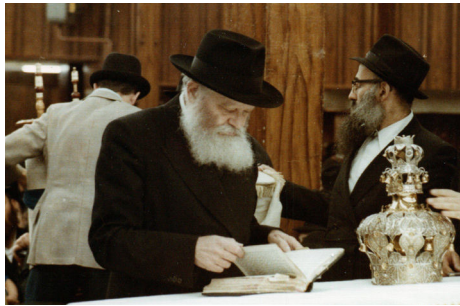
הרבי שליט"א מלך המשיח

שבתי הכנסת צריכים להיות מלאים בחג השבועות בעת קריאת עשרת הדיברות, ובמיוחד יש להביא את הילדים, ואפילו תינוקות רכים, שכן בזכות הערבות שלהם זכינו לקבל את התורה, וחשיבות מיוחדת קיימת לכך שהם עצמם יהיו נוכחים ברגעים אלו ויקבלו חיזוק ורגש מיוחד בכל הנוגע ללימוד התורה. בקשר לכך ידוע גם העניין להקנות לילדים ולתינוקות באופן כללי את החיבה לתורה הקדושה, בין השאר על ידי השמעת שירי ערש ליד המיטה על כך שהתורה היקרה טובה מכל סחורה.