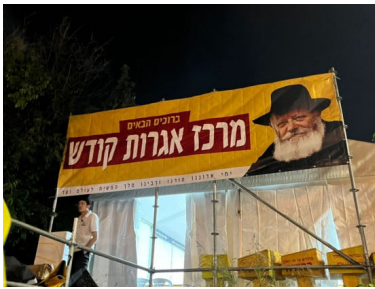
הדוכן במירון השנה

אלא שהמשטרה הודיעה מראש שלא תאפשר פתיחת מתחמים שכאלו באיזור הציון, אלא רק במתחם המורחב החדש, שנפתח למטרה זו למרגלות ההר