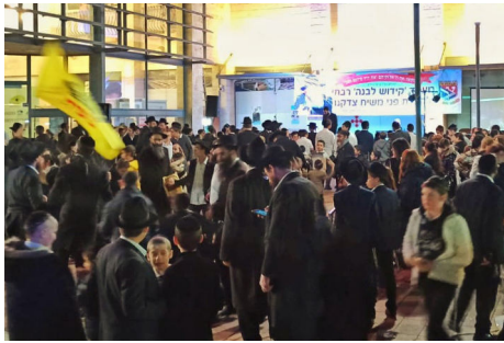
קהל גדול במעמד 'קידוש לבנה' בביתר עלית

"עשינו פרסומת בכל העיר, גם עם מודעות פרסום וגם עם כתבות בעיתונות המקומית. הפעם הראשונה הפתיעה אותנו באמת, הגיעו מאות אנשים והיתה שמחה אמיתית. זכינו להצלחה גדולה שאפילו לא ציפינו לה. באירוע מודגש כי הוא מתקיים לקבלת פני משיח בפועל ממש, והוא מלווה בהכרזה 'יחי אדוננו מורנו ורבינו מלך המשיח לעולם ועד'. מאז מתקיים המעמד באופן קבוע אחת לחודש ברוך השם".