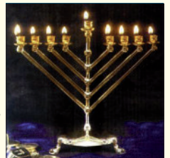
(נר א' דחנוכה ה'תשנ"ב. מתוך התוועדות ה'תשנ"ב כרך ב')

ולהוסיף, שימי חנוכה שייכים ביותר לגאולה האמיתית והשלימה – כי, הדלקת נר חנוכה היא לזכר נס השמן שהיה במנורת בית המקדש כשנתחנך מחדש ע"י החשמונאים, וזוהי ההכנה לבנין וחנוכה והדלקת המנורה בבית המקדש השלישי, בגאולה האמיתית והשלימה ע"י משיח צדקנו.