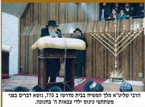
הרבי שליט"א מלך המשיח בבית מדרשו ב 770, נושא דברים בפני משתתפי כינוס ילדי צבאות ה' בחנוכה.