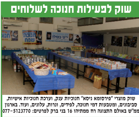
שוק מוצרי "פירסומא ניסא" חנוכיות ענק, וערכת חנוכיות אישיות, סביבונים, ומטבעות דמי חנוכה, לפידים, ונרות, עלונים, ועוד. בארגון מ"ש באולם התצוגה רח ממתיו 16 בני ברק לפרטים: 077-5123770

והימים האלה נזכרים ונעשים. וכפירוש האריז"ל