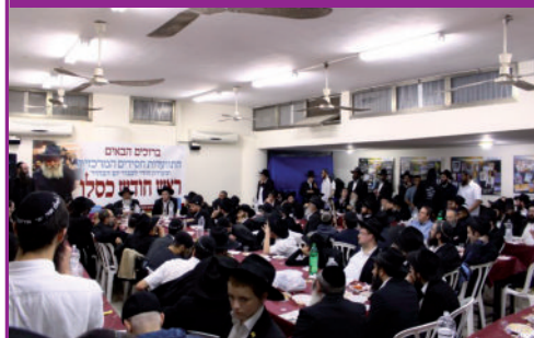
בראש חודש כסלו נערכה התוועדות מרכזית באולם מרכז ההפצה "ממש" בני ברק בהשתתפות משפיעים וקהל חסידים.

על גדלותו הרוחנית ודביקותו העילאית של אדמו"ר האמצעי בתורת החסידות, תעיד אימרתו המופלאה של חתנו אדמו"ר הצמח צדק שהעיד כי "אם היו חותכים לחותני אצבע לא היה יוצא דם אלא חסידות". ללא גוזמא, כפשוטו ממש.