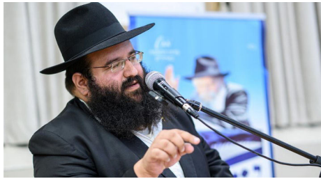
הרב לוי יצחק ווייס

עצם ראיית פניו של הרבי שליט"א מלך המשיח, היא בעלת השפעה גדולה על המתבונן. הוא מספר על שליח באחד מבתי חב"ד בארץ שתלה על מרפסת ביתו את השלט עם תמונת הרבי שליט"א מלך המשיח והסלוגן 'משיח - מעשה קטן והוא כאן'. לאחר זמן שמע מאחת השכנות בבנין הסמוך כי מידי יום היא יוצאת לעשן במרפסת ורואה את השלט. בשבת היא חשה אי נעימות לעשן כך אל מול התמונה, ולכן מזה תקופה שהיא הפסיקה לעשן בשבת.