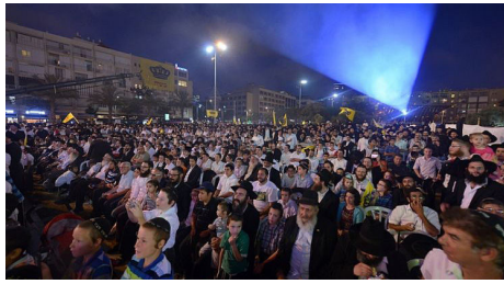
מראה כנס 'משיח בכיכר' בשנת הקהל הקודמת

מצביע על תפקידם של הכהנים בליל קריאת התורה של הקהל, ולהסתובב ברחובות ירושלים ולתקוע בחצוצרות, עד כדי כך שאמרו על כהן שאין לו חצוצרה 'דומה שאינך כהן'. כך גם אנו, אומר הרבי שליט"א מלך המשיח, צריכים להיות שיהיה ניכר על כל אחד שהוא אכן 'יהודי של הקהל', שזהו כל ענינו.