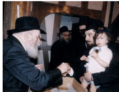
שנה טובה ומתוקה חזי שנה, מחלק הרבי שליט"א מלך המשיח, לפני יום כיפור פרוסת עוגת 'לעקא' לכל אחד

ענינה של השבת, היא סיום העבודה כולה ושלמותה, באופן שהכל נגמר. כפי שהיה בשבת הראשונה, כאשר בורא העולם, סיים את בריאתו בששה ימים, וביום השביעי הושלמה מלאכתו. כפי שאנו מזכירים זאת בקידוש: "ויכולו השמים והארץ...". תורת וישובות ביום השביעי". תורת הסוד מגלה כי שלימות כל הענינים הוא בעלייתם אל עולם רוחני נעלה יותר. וכך העולם כולו, שנברא באמצעות הדיבור, מתעלה בשבת לעולם הנעלה ממנו שזהו עולם המחשבה. מכאן גם הדיוק המופיע כי שבת אותיות תשב, מלשון תשובה, במשמעות לשוב ולחזור למקור ולמקום הגבוה יותר. עניינה של השבת וענין התשובה הינם דבר אחד.