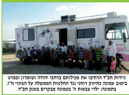
ניידות חב"ד הרכיבו את פעילותם ברחבי יהודה ושומרון ובפרט ביישוב עמונה כחיוק רוחני נגד החלטות הממשלה על הפינוי ח'ו. בתמונה: ילדי צבאות ה' בעמונה מבקרים בשוק חב"ד.