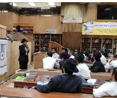
לומדים על בית הבחירה שיעור בהלכות בית הבחירה, בליווי מפות והדגמות, מתקיים ב-770 מדי יום בימים אלו

זאת אומרת, שאם בעבר היו לומדים ענינים כאלו, כ"הלכתא למשיחא", כהלכות שאינן נוגעות למעשה בפועל, כי אם יחולו אי פעם בימות המשיח, הרי שכעת הפכו הלכות אלו להיות מעשיות יותר מאי פעם, מאחר ובית המקדש השלישי מוכן כבר בשמים ועומד לרדת למטה בכל רגע.