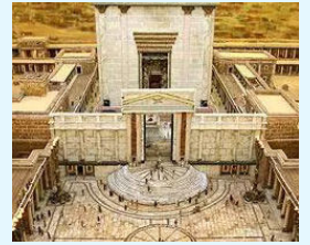
במרכז הדגם: שערי ניקנור

שערי ניקנור היו בצד מזרח, מכוונים כנגד בית קדש הקדשים באמצע. שם היו שתי לשכות לשכת פנחס המלביש, ולשכת עושי חביתין. שער ניקנור היה השער המפואר והמפורסם ביותר מבין שערי המקדש ושימש ככניסה הראשית לעזרה. מבחינת קדושה השער נחשב כחלק ממחנה לווייה (עזרת הנשים) ולכן יכלו המצורעים המיטהרים לעמוד תחתיו בשעת טהרתם.