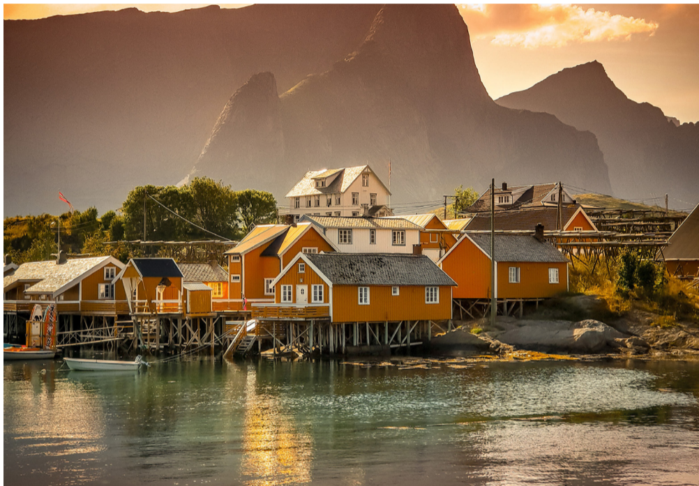
נורווגיה. האושר האמיתי?

משהו שיודעים שזה מה שהשם רוצה. בדרך כלל זה לעזור למישהו. ואם נשים לב, נראה שתיכף אחר כך - פתאום נהיים מאושרים.