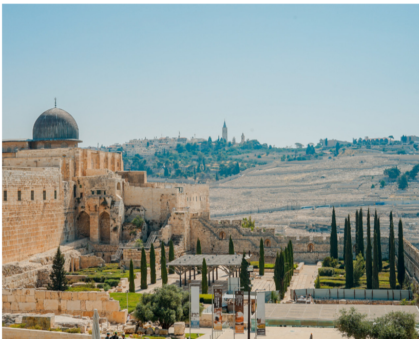
חומות ירושלים העתיקה. בקרוב חומות מסוג אחר

עוני ומחסור כיום הינם דבר מצוי ושגרת, לצערנו • אך בכוא הגאולה האמיתית והשלימה נהיה עסוקים בדברים יותר חשובים מכסף • וגם בלעדי זאת, העושר לכשעצמו יהיה רב כל כך עד שלא ייחשב בעינינו כלל • מעדנים מצויים כעפר!