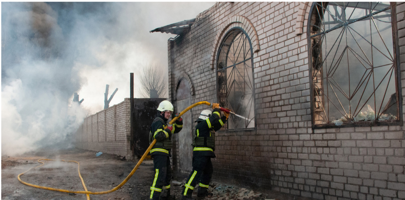
מלחמת רוסיה ואוקראינה, בעלת השפעות על הכלכלה העולמית

הגירעון הממשלתי נעלם מזה חודשים ואת מקומו תפס עודף בקופת האוצר • התחזית הכלכלית שמנבאת שחורות למערב ולמדינות מפותחות רבות, דווקא מחמיאה לישראל וחוזת צמיחה יציבה ומתמדת • וגם – מספר השיא של מיליארדרים יהודים וישראלים ברשימת עשירי העולם 2022 • "לי הכסף ולי הזהב נאום ה"