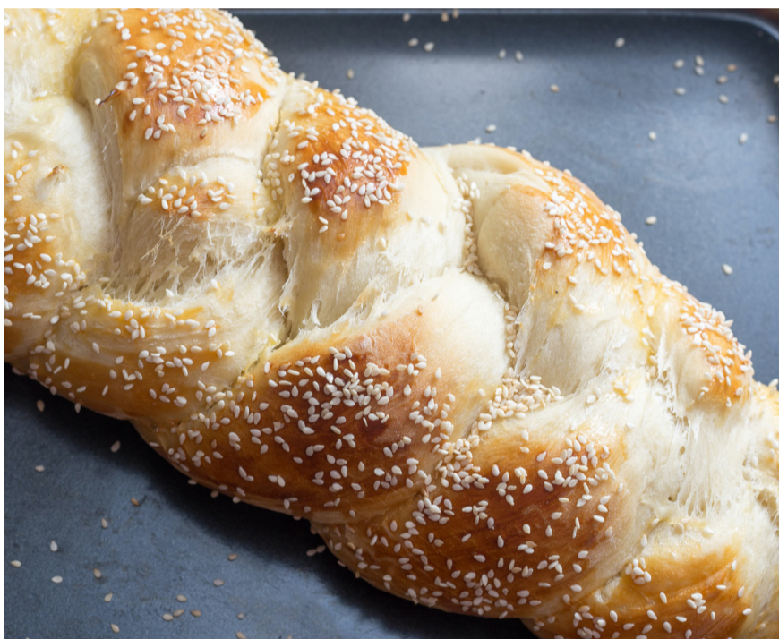
הפרשת חלה, המצווה שמלמדת אותנו איך מתאחדים

הטור מבוסס בחלקו על שיחת הרבי שליט"א מלך המשיח בליקוטי שיחות חלק ב', עמ' 584 והלאה. ■