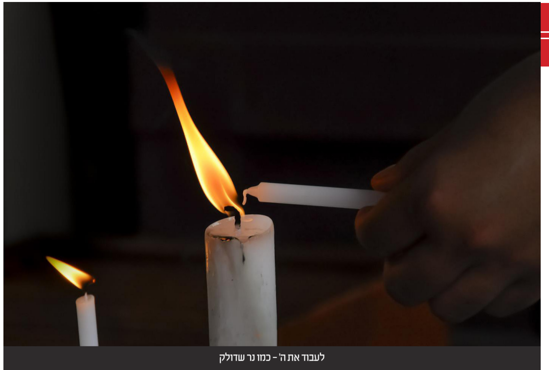
לעבוד את ה' - כמו נר שדולק

עובדה זו גורמת שמחה וחשק יותר בעבודתנו, ומתוך שמחה זו יש לנו כח להאיר את עצמנו ואת כל הסביבה ולהביא גאולה אמיתית ושלימה לנו, ולעולם כולו, תיכף ומיד ממש.