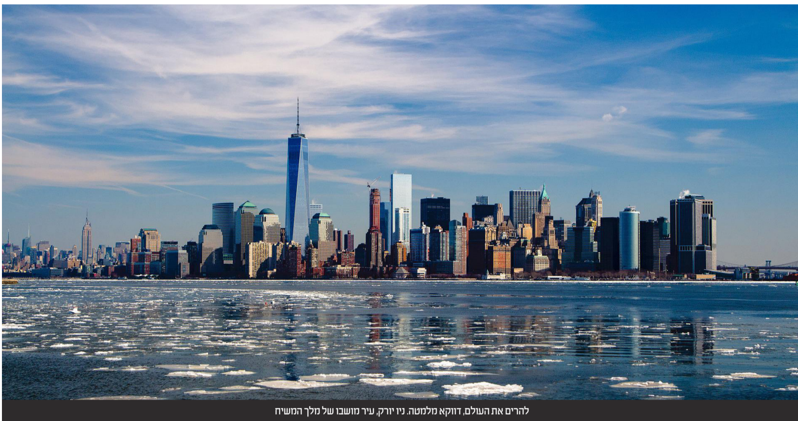
להרים את העולם, דווקא מלמטה. ניו יורק, ניר מושבו של מלך המשיח