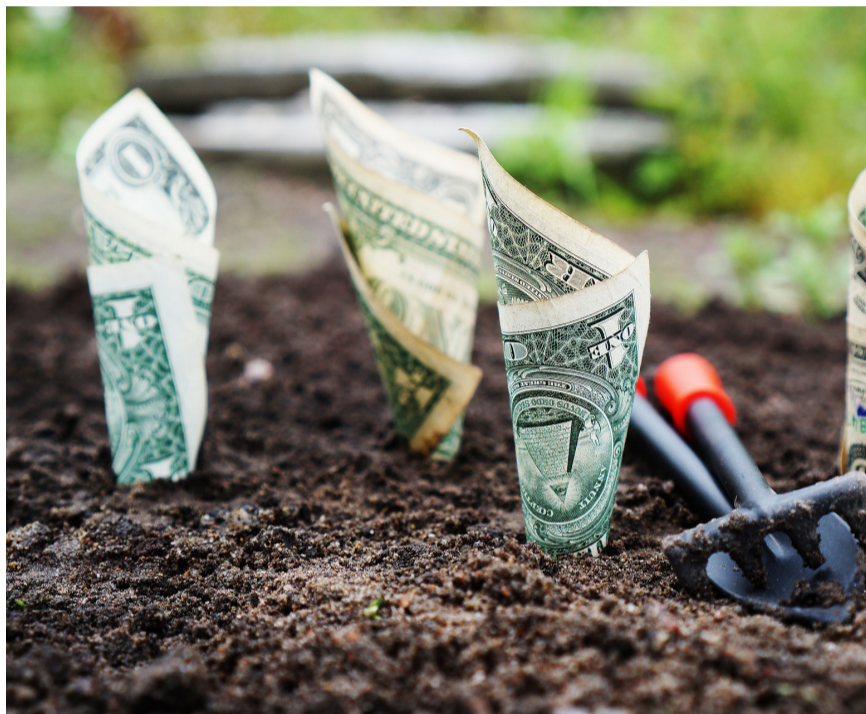
האם הכסף הוא מקור האושר?

מה למדנו? שלא צריך כסף כדי להיות מאושר, ודיכאון איננו גזירת גורל עולמית (וגם בו יש דרכים לטפל בשיטות ורפואות שונות ברמה האישית). דווקא הנתניה והעזרה ההדדית של פתיחת הלב היא זו שמביאה את מדד האושר קרוב אלינו. ■