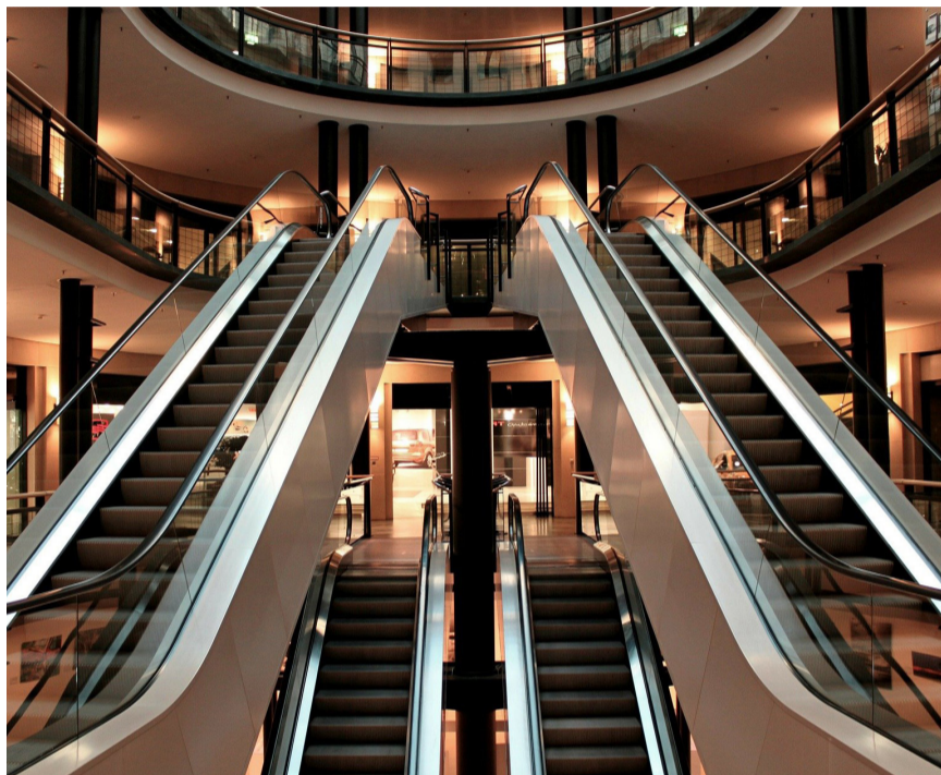
רדיפה אין סופית שלא נגמרת. האם יש לה סוף?

רדי" זעק מכלוף קליינרוביץ (המכונה "סבא פיקולינו") בצער, מתנה את מצוקתו עם הרב פרידמן "כל החיים רודפות אחרי אותן מילים. כמה שאני מנסה להשתנות תמיד זה בסוף חוזר אלי. בסוף כל ההשקעה שלי יורדת לטמיון ואין לי שום דרך להיפטר מהבעיה הזו."