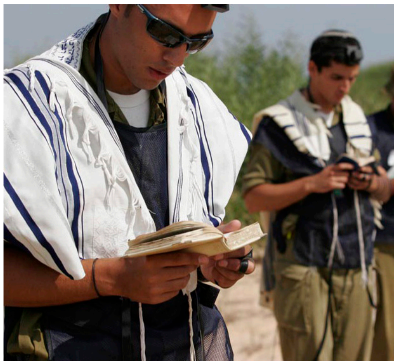
ציצית שומרת בהווה ומסייעת בעתיד

המסירות האבסולוטית הזו מורגשת בכל רמ"ח האיברים. כל הורה ששלח את ילדו למתנה הנפלאה הזו יכול להעיד על כך. הילדים חוזרים מושפעים מטוב, ומשופעים בתוכן ואהבה שלא ניתן למצוא בשום מסגרת חווייתית כזו.