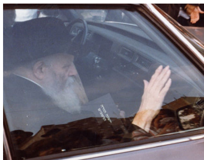
רמב"ם גם בדרך הרבי שליט"א מלך המשיח, בנסיעה במכונית, כשבזיכרון הק' ספר משנה תורה להרמב"ם

הצדיק השני עימו יחגגו המוני בית ישראל, הינו רבי שמעון בר יוחאי רשב"י, שיום הילולתו הפך לחג אצל כל בית ישראל. על ידיעתו בתורת הסוד של מחבר ספר הזוהר, אין צורך להרחיב, אך חשוב לציין כי הוא מובא פעמים רבות גם בגמרא ובמשנה.