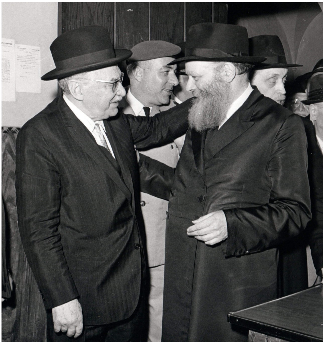
מר שז"ר באחת מפגישותיו עם הרבי שליט"א מלך המשיח

משהו ממה שקורה עכשיו ניתן להבין לאור הנאמר במקורותינו הקדושים.