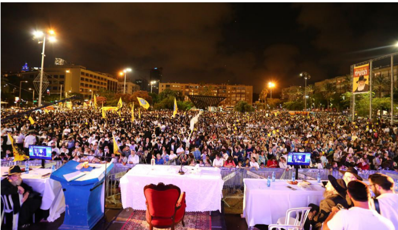
מאמינים באמונה שלימה. עצרת ענק משיח בכיכר

חמשת אלפים שבע מאות שמונים ושתיים שנה זה מחכה, והנה עכשיו זה קורה • מהי המטרה הסודית של כל ההליך ואיזו תאווה אנו צריכים להשלים • מיהו זה שיצליח להביא את העולם כולו להכרה המושלמת