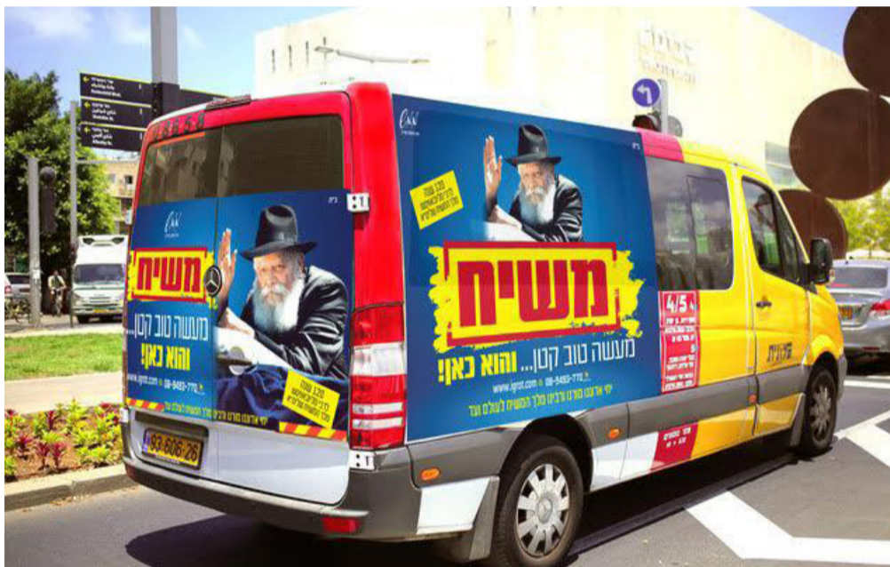
אחת ממאות המוניות במסגרת קמפיין הענק בחצוצות ישראל

על-מנת שימצא השיר המוצלח ביותר מתכנסת ועדה של מוזיקאים בעלי שיעור קומה, הבוררת מתוך השירים הרבים את המוצלח ביותר ומכתירה אותו לשמש כשיר החדש של השנה, שינגון על-ידי הקהל בכל אירוע בהשתתפות הרבי מלך המשיח שליט"א לאורך השנה הקרובה.