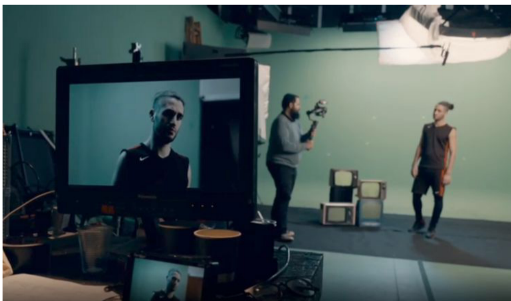
במהלך הצילומים לקמפיין

את הטוב הזה לא כדאי לכם לפספס, בואו גם אתם למסע קצר, עוצמתי וחוויתי, לרגל יום הולדתו המאה ועשרים של הרבי מלך המשיח שליט"א - שיביא אתכם מוכנים אל הגאולה. כנסו עכשיו לאתר הקמפיין: ani-maamin.co.il