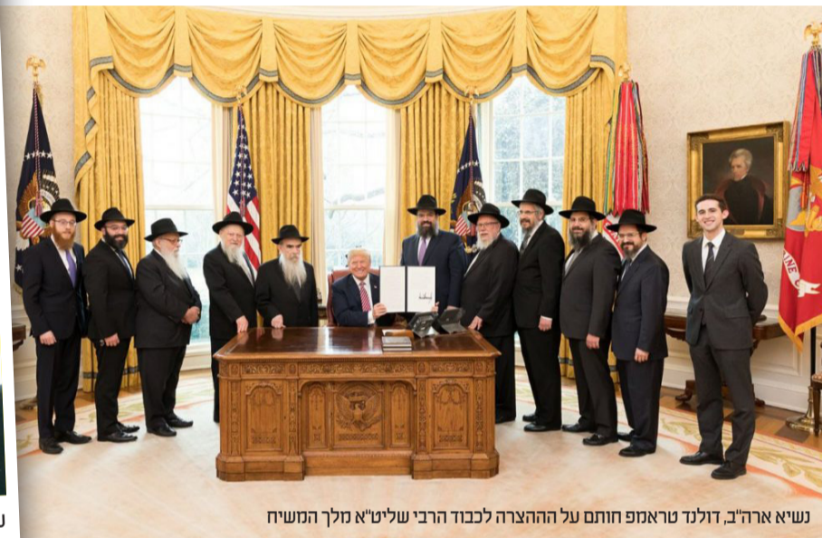
נשיא ארה"ב, דולנד טראמפ חותם על ההצעה לכבוד הרבי שליט"א מלך המשיח

מכירים ברמב"ם? השיב, שרואים בתורה שאחת הברכות המיוחדות שהקב"ה אומר לאברהם אבינו היא "ברוך תהיה מכל העמים", שהעמים יברכו את בני ישראל. כפי שאנו מוצאים ממגילת אסתר "וכל שרי המדינות... מנשאים את היהודים... כי גדול מרדכי בבית המלך ושמעו הולך בכל המדינות כי האיש מרדכי הולך וגדול" (אסתר ט, ד).