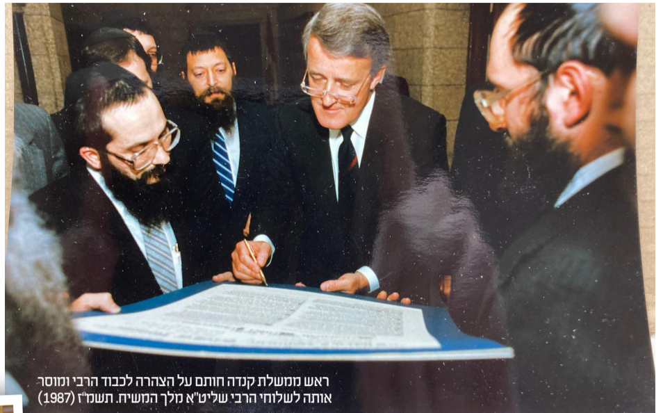
ראש ממשלת קנדה חותם על הצהרה לכבוד הרבי ומוסר אותה לשלוחי הרבי שליט"א מלך המשיח. תשנ"ז (1987)