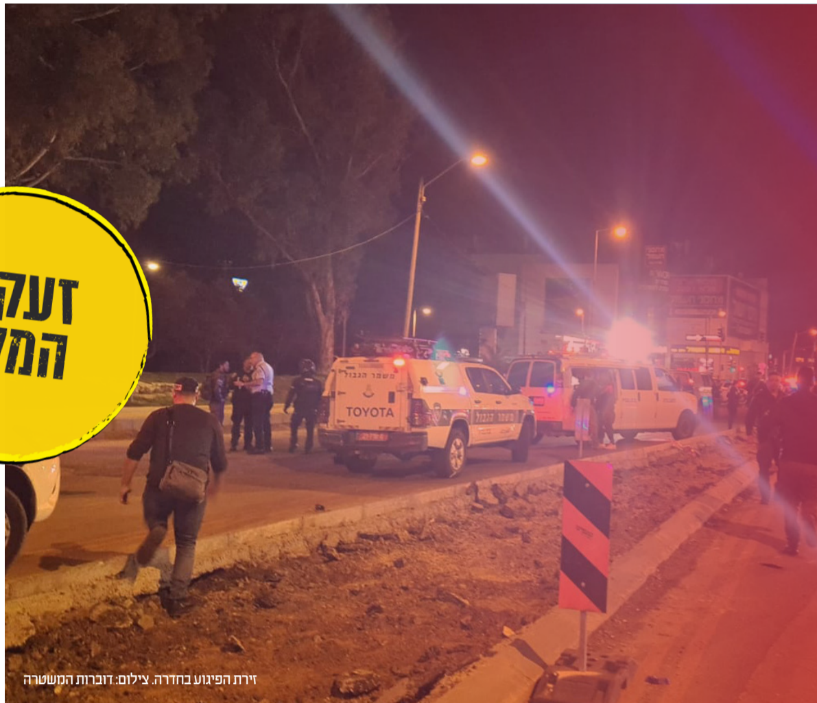
זירת הפיגוע בחדרה.