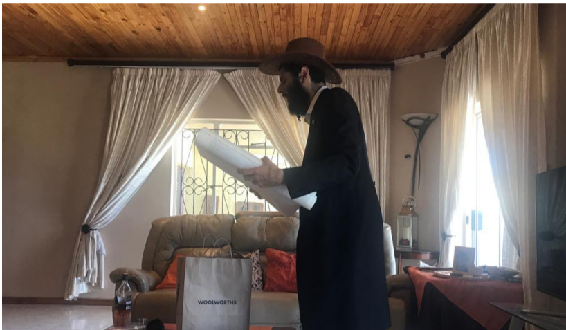
קוראים מגילת אסתר בנימיניה, אפריקה

תנופה אדירה בפתיחת נקודות פעילות של חב"ד ברחבי העולם • עוד ועוד זוגות צעירים עוזבים את הקן החמים ויוצאים לארצות רחוקות על מנת להכין את המקום לקבלת פני משיח צדקנו • הצלחתם - הצלחת כולנו