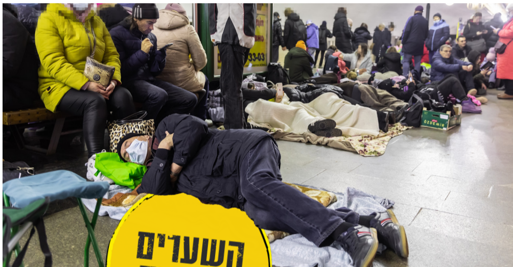
הפליטים יוכלו להגיע לישראל בחופשיות?

תהליך זה, יש בו מעין ביטול המציאות – ההבנה כי מציאות העמים אינה דבר חשוב בפני עצמו, אלא חלק קטן הבטל לדבר הגדול – בורא העולם. זו ההבנה העמוקה והאמיתית ל"ביטול מציאותם" של הגויים בגאולה הקרובה.