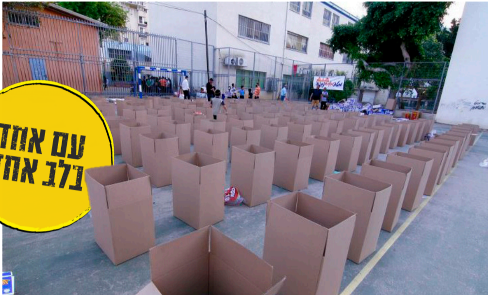
אריזת סלי מזון במרכז החסד של חסידי חב"ד בנתינת

ונוסף לזה, גם לאחר נתינת צרכי החג "כדבעי לי למהווי", מעשה ועד לחומש (מצוה מן המובחר) - צריך לעשות חשבון שלפי-ערך ההוספה בברכתו של הקב"ה בימים שבינתיים, גדל גם הסכום דמעשר או חומש, ובמילא, צריך להוסיף יותר בנתינת צרכי החג. ויתירה מזה: על פי מארז"ל "עשר בשביל שתתעשר" - יכול וצריך להוסיף בנתינת צרכי החג (נוסף על המעשר והחומש) עוד לפני ההוספה בברכתו של הקב"ה, וככל שירכה להוסיף בנתינת צרכי החג, תגדל יותר ברכתו של הקב"ה בעשירות מופלגה (כמדובר בארוכה לפני זה).