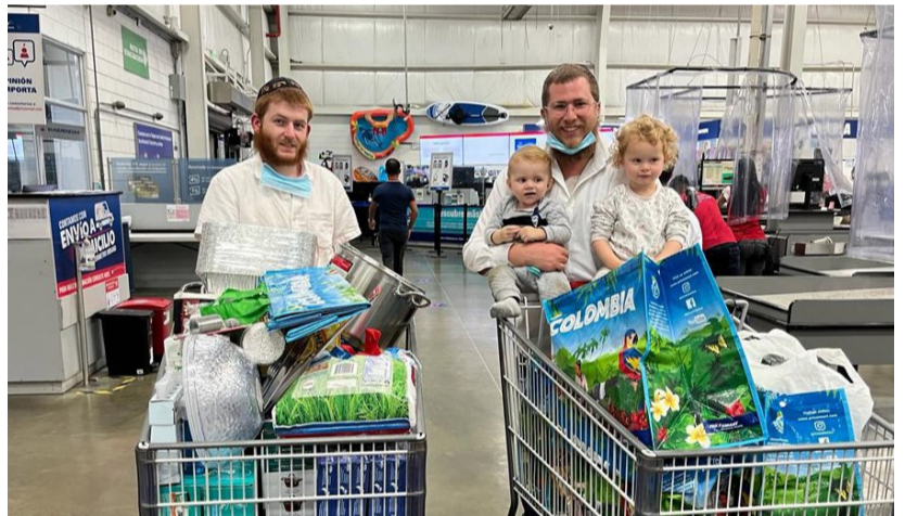
סירים, כריות, סכום וכלי בית. בסיומו של מסע קניות לבית חב"ד החדש סלנטו, קולמביה