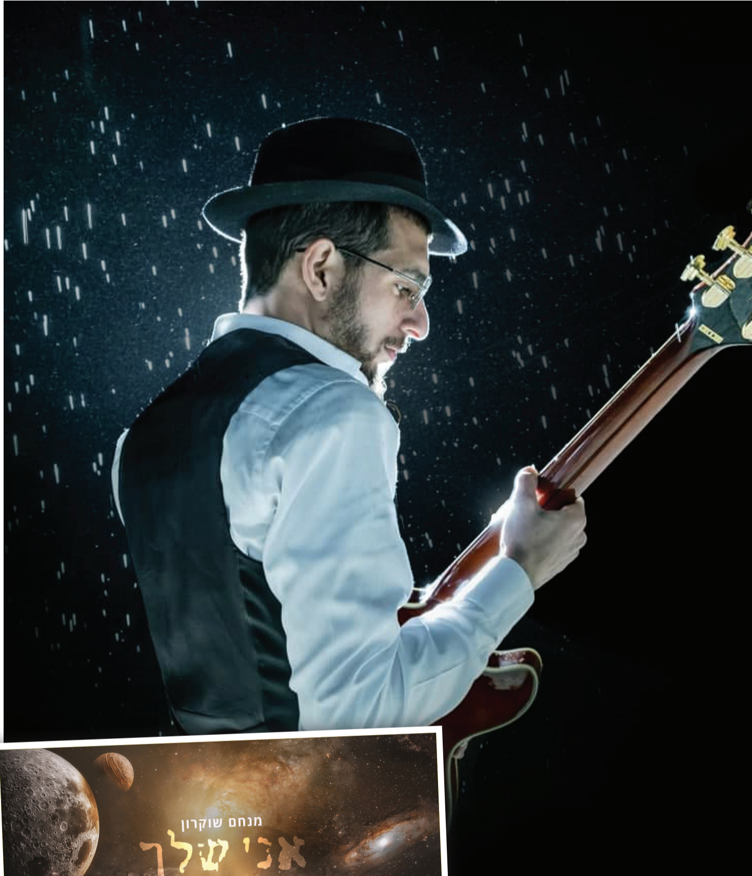
עטיפת הסינגל החדש

אך הגאולה העכשווית, בדורנו, תפקידה לגאול דווקא את העולם עצמו, לא לברוח ממנו אלא לרתום אותו לשירות הקדושה. כי גאולה היא בעצם 'גולה' בתוספת א'.