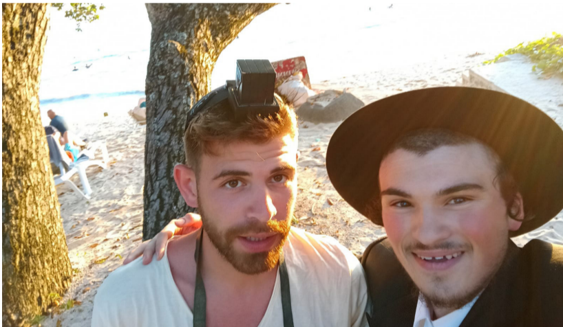
התפילין הראשון עם נחיתתם של הזוג הרטמן בויקטוריה, איי סיישל