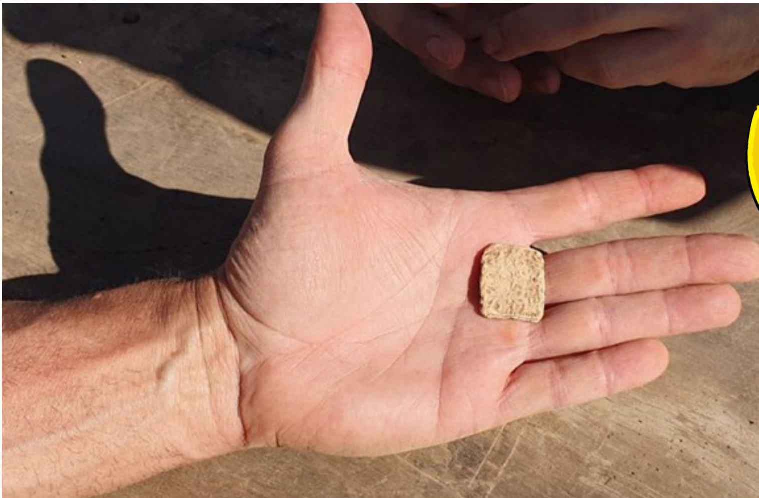
הגילוי המרעיש שנמצא בחפירות.

ואולי הלוחית הקטנה הזו שהמתינה אלפי שנים והתגלתה דווקא עכשיו, תשמש כעזר ממרום לשכנע את בני האדם שעדיין מהלכים באפלה, לנצל את הרגעים האחרונים שנתרו עדיין לבחירה חופשית, להכרה באמת האלוקית. לדעת שהיא ממתינה להם בספר הספרים שנמצא בכל מקום. לא צריך לחפש הרבה. צריך רק לפקוח את העיניים, ולמצוא.