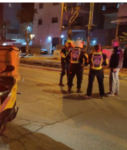
זירת הפיגוע בחדרה

עליו, ויעשה לו, רחמנא-ליצלן, מה שעשה בעבר!