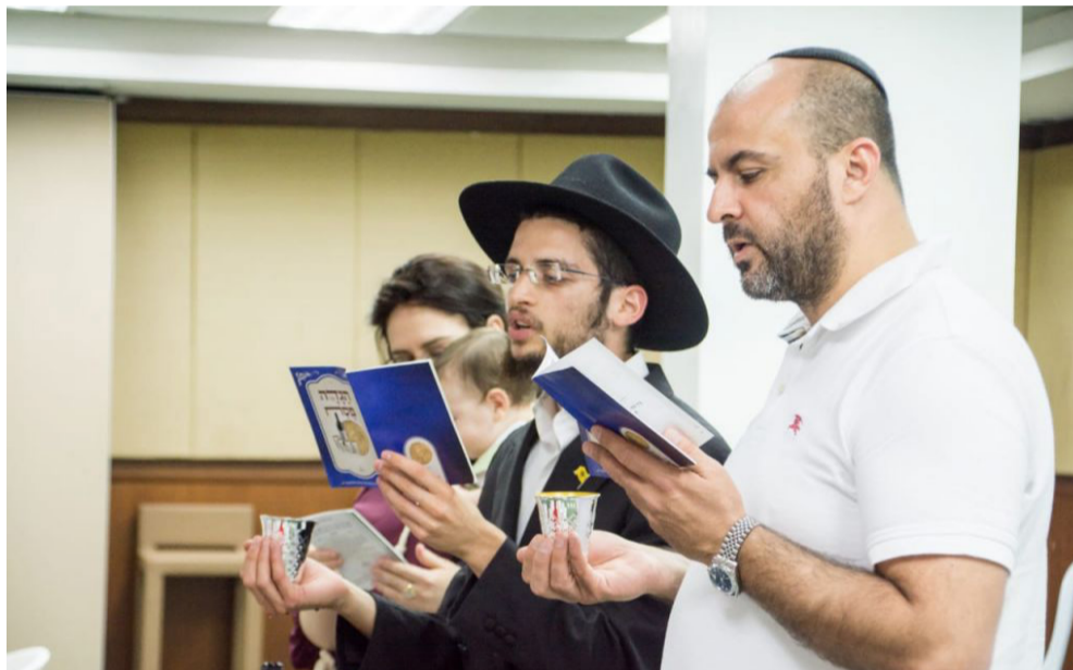
סדר ליל פסח. צולם לפני כניסת החג (ארכיון)

אין ספק - חג הפסח הקרוב, ליל הסדר של השנה, יהיה אירוע שלא נשכח לעולם.