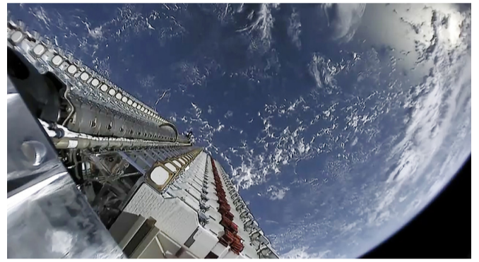
60 לויני סטארלינק על גבי חללית, לפני פיזורם

לזה, ביקש מאסק מהאוקראינים לנקוט באמצעי זהירות, להסוות את תחנות הקליטה, להפעיל אותן רק לצרכים חיוניים, להרחיק אותן מאנשים ולהישמר ככל יכולתם מחמת הפצצות רוסיות. לצידו של מאסק, הציעו חברות מערביות נוספות ורבות מתחומים שונים כדי לעזור לאוקראינה לשמור את התשתיות שלה בזמן המלחמה. עם פרוץ הקרבות הפיזיים,