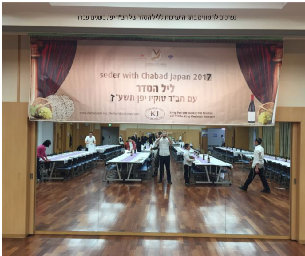
נערכים להמונים בחג. היערכות לליל הסדר של חב"ד יפן, בשנים עברו

לקראת סוף החג, ביום האחרון של חג הפסח, יתקיימו סעודות משיח' בכל בתי הכנסת, בתי חב"ד ובבתים פרטיים רבים. על פי המנהג, יש ליטול ידיים לאכילת מצה, ולשתות ארבע כוסות של יין (או מיץ ענבים) ובכך להמשיך את הארת המשיח המאירה ביום זה. השלוחים נערכים לפרסום המבצע בקרב תושבי הערים, ובחלק מהמקומות אף יתקיימו סעודות אלו, כהכנה לקראת סעודת ה'מימונה' המסורתית המבטאת אף היא את האמונה.