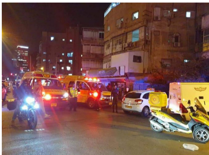
זירת הפיגוע בבני ברק

"בתקופה האחרונה שומעים על מקרים רבים של חבלה בהם נהרגו כמה-וכמה מישראל, אזרחים או חיילים" - אומר הרבי מלך המשיח שליט"א. "התירוץ שמשמיעים על