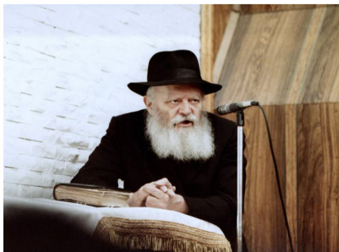
הרבי שליט"א מלך המשיח: לעצור את הדיבורים עם הערבים