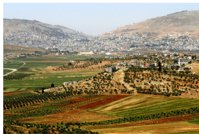
הר עיבל והר גריזים

המידע החדש-ישן חולל סערה בתחומי מחקר רבים.