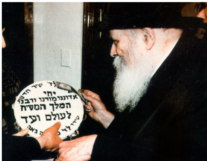
הרבי שליט"א מלך המשיח מקבל תוף שהכינו נשים לשמחת הגאולה

היום בדורנו, אנו למדים מרועה הדור שלנו, הרבי שליט"א מלך המשיח, שהסוד העצום הוא אהבה עצומה, אהבתו לכל יהודי ללא גבולות וללא הגבלות, לכל אחד באשר הוא ובמקום בו הוא נמצא, ללא מסכים וחציצות, ללא דעות קדומות. לנו נשאר רק לאחל שנוכל לאהוב כך את ילדינו ולתת להם כלים ממקום טהור ונקי, שיאדיר אותם ויעצים אותם מעלה מעלה כבני אדם מוסריים וכיהודים גאים, מתוך אהבה עצומה.