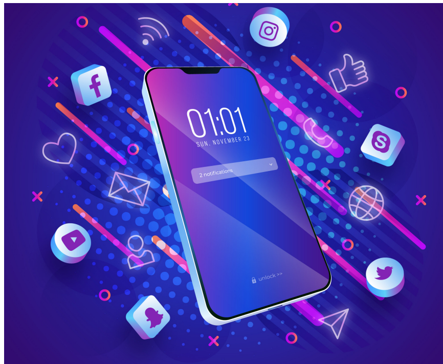
להתנתק כדי להתחבר

"אני מקנאה בך", אמרתי לה. הלוואי ויכולתי לעשות את זה גם. ושמחתי מאוד מאוד בלב, שהיא נתנה לעצמה מתנה נדירה: את הזמן לגדול בשקט. ■