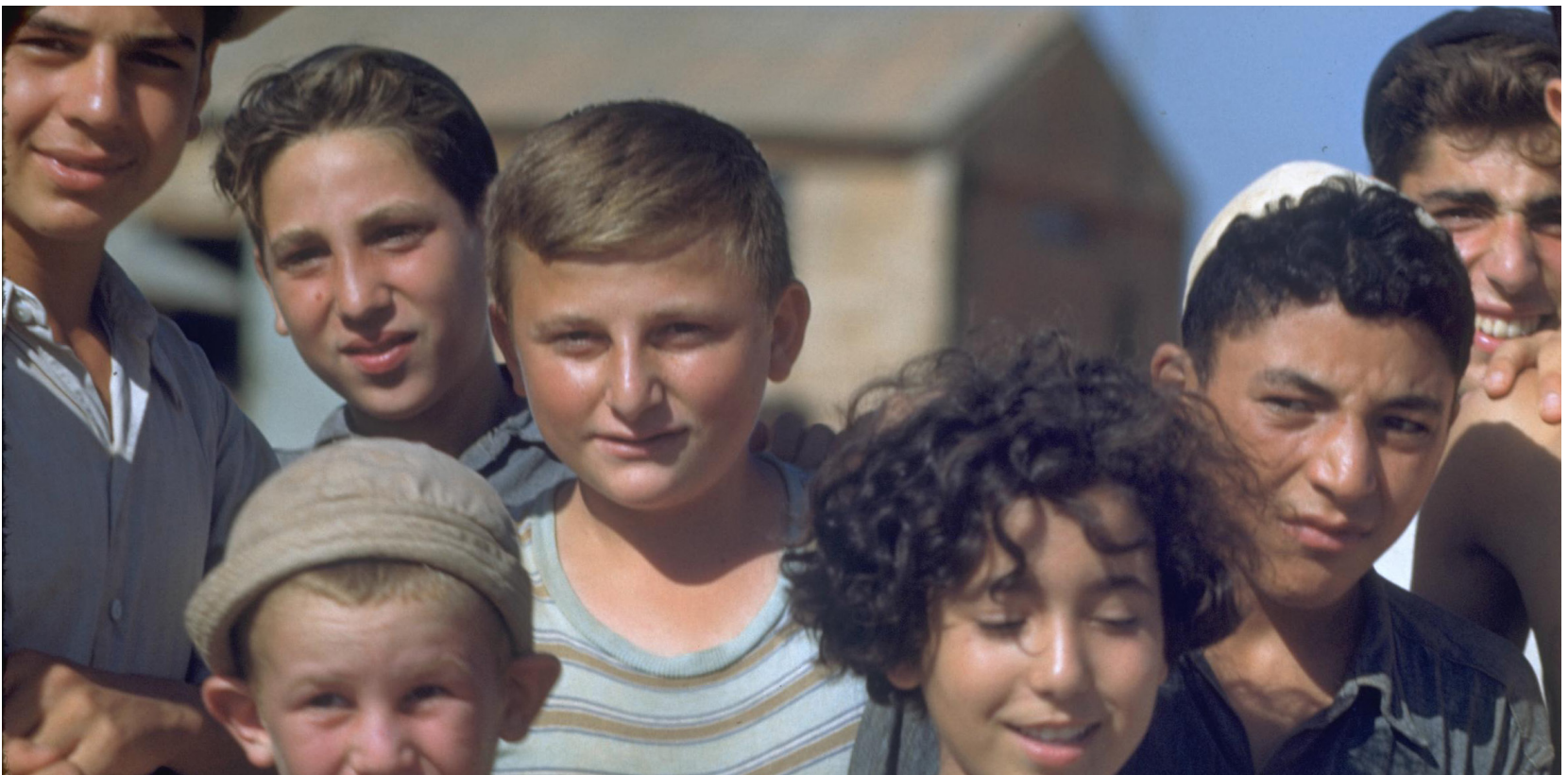
ילדים עולים ממדינות שונות בצילום משותף במחנה קליטה של עליית הנוער ליד כרכור.