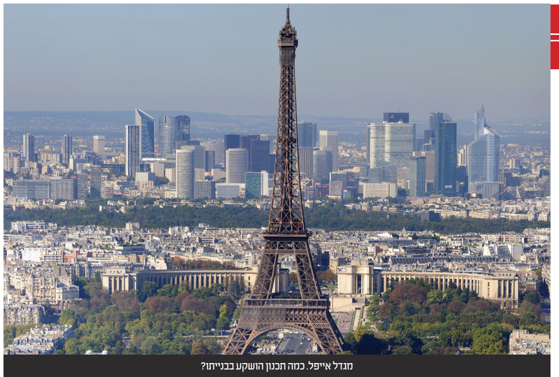
מגדל אייפל. כמה תכנון הושקע בבנייתו?

זהו המסר העולה משלושת השלבים. יהודי מצד עצמו הוא קודש קודשים ולא שייך בכלל למציאות של חטא חס ושלוש. כל מקרה שנראה כירידה הוא גם חלק מהתהליך שאותו קבע הבורא, ולכן אין מה להתפעל מכך. צריך לשים מול העיניים רק את המטרה, להגיע אל השלב השלישי הנכסף - הגאולה האמיתית והשלימה בפועל ממש.