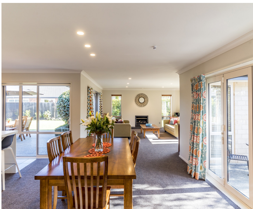
בית פרטי או משכן לה, תלוי במעשיך

בהצלחה אישה יהודיה! כי "את עלית על כולנה!" ■