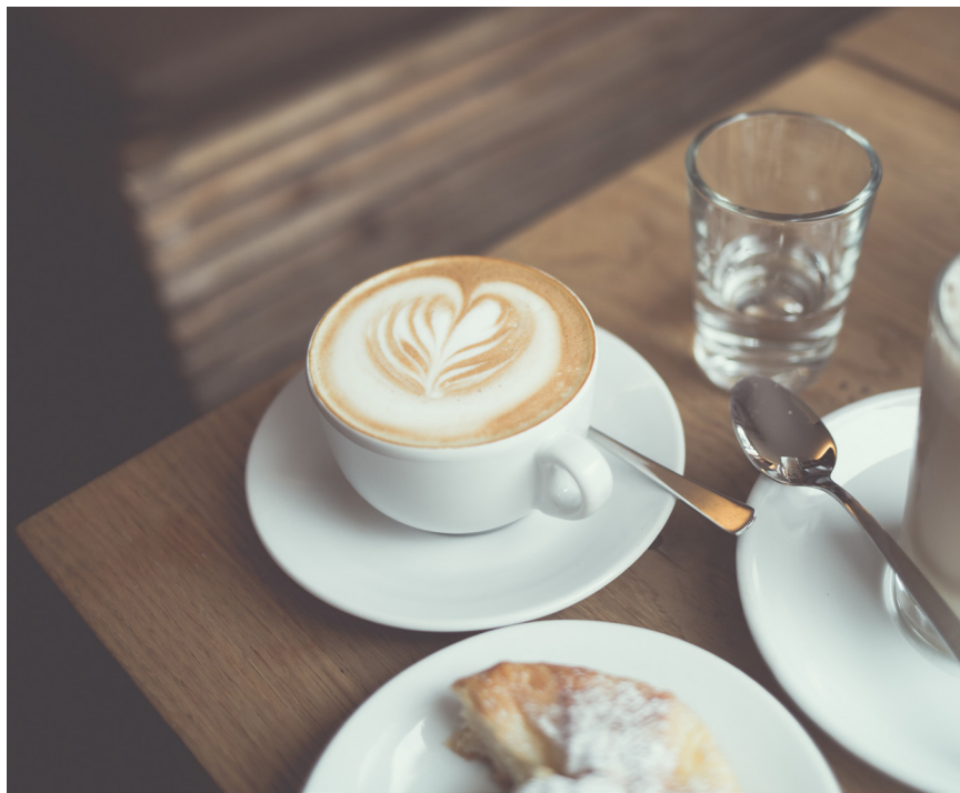
קפה או תה, זה לא משנה. העיקר חסר

כשם שבתקופת המדבר, כל עוד שלא נבנה המשכן בפועל ובגלוי, אזי למרות הכוונות והתוכנות הנעלות ביותר - עדיין לא התממשה בגשמיות המטרה העיקרית שלשמה נועדה נתינת התורה כסיני - חיבור הקדושה לעולם, כך גם כעת, בזמננו זה, ברגעים הספורים שלפני הגאולה, את "בשורת הגאולה" שמשמיע לנו משה שבדורנו הרבי שליט"א משיח צדקנו צריך לראות ולקיים בפועל ממש, כאן ועכשיו, בהתגלות בעולם הזה הגשמי לעיני עם ישראל וכל העולם כולו בכל קצווי תבל - ומתוך שמחה וטוב לבב! ■