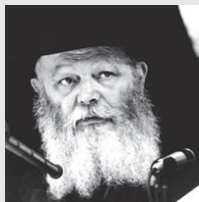
(משיחת מוצאי שבת-פרשת משפטים התש"ט - בלתי מוגה)

וכמו-כן ישנו המבצע של אי-נתינת אף שעל מארץ הקודש, שכעת אין כלל צורך בראיות והוכחות עד כמה מסירת שטחים נוגעת לקיומם של יהודי ארץ ישראל. וכן המבצע של "שלימות העם" ביטול החוק האומלל של מיהו יהודי!