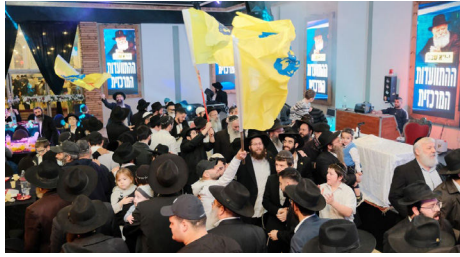
חלק ממעגלי הריקודים באירוע

לסיום מוזמן הרב דוד נחשון, יו"ר ניידות חב"ד וצבאות ה' החותם בדברים נרגשים בדבר הזעקה להתגלות הרבי שליט"א מלך המשיח תיכף ומיד ממש. הערב נחתם בהגרלה בין המשתתפים על כרטיס טיסה ל- 770.