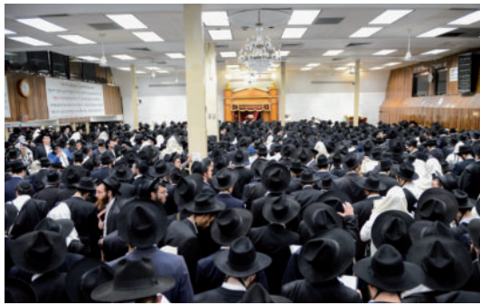
התפילות 7702 במחיצת הרבי שליט"א מלך המשיח

לנוכח העלות הכספית האדירה, הוכרו על מגבית רחבה בכותרת "יום הכנסת אורחים", בה מקווים בארגון לגייס את הסכום הגדול הנדרש למימון חודש החגים. גדולה זכות זו לזירוז הגאולה האמיתית והשלמה, עכשיו ממש.