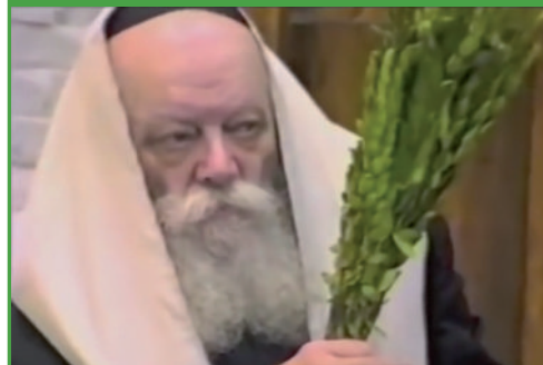
הרבי שליט"א מלך המשיח בתפילת ההושענות בחול המועד חג הסוכות.

תיאורי חז"ל על מעלת עננים אלו, אין בכוונתם להעשיר בפנינו את תמונת העבר, אלא בעיקר להכין אותנו למפגש הקרב של כל ישראל, עם ענני הכבוד.