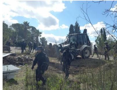
הרצח וגם ירשת? כוחות ההרס בישוב חומש הורסים את מבנה הישיבה

כל זה לא ריפה את ידי התלמידים. בחורפים קרים ובימי שמש קופחים הם מגיעים ללמוד תורה במקום. במבנים מאולתרים הם הקימו את בית המדרש, שם נשמע קול התורה, תוך ציפיה להקמתו המחודשת של הישוב. על קיר בריכת המים הנצפת למרחוק, מופיעה הכתובת הבולטת "חומש תחילה", תוך הבנה כי בעזרת ה' החזרה לחומש, תניע את הגלגל לביטול כל הליך הגירוש, וחזרה לכל הישובים.