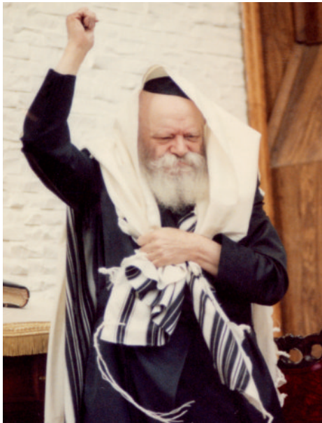
מעשיך. כעת החל מילוי המשימה "נתאוה הקב"ה להיות לו ית' דירה בתחתונים". המשכת גילוי עצמותו בעולם הזה התחתון.

העולם כבר הוכשר לגילוי של עצמותו ומהותו ית', צריך להתעקש בדרישה להתגלות הרבי שליט"א מלך המשיח, עוד בשבת זו של תשע"ו, ואזי בראש השנה תשע"ז נהיה כולנו בבית המקדש השלישי, בירושלים עיר הקודש, בגאולה האמיתית והשלימה ומתוך שמחה וטוב לבב.