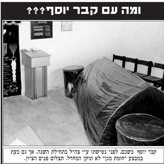
קבר יוסף בשכם, לפני נטישתו ע"י צה"ל בתחילת השנה. אך גם כעת במבצע "חומת מגן" לא תוקן המחדל. תצלום פנים הציון.

הלכה ברורה בשולחן ערוך, סימן שכ"ט, מבהירה מה לעשות: "נכרים שצרו על עירות ישראל... אם באו על עסקי נפשות, ואפילו באו סתם, ויש לחוש שמא באו על עסקי נפשות, ואפילו לא באו אלא ממשמשים לבוא, יוצאים עליהם בכלי זין ומחללים עליהם את השבת, ובעיר הסמוכה לספר, אפילו אינן הוצים לבוא אלא על עסקי תבן וקש מחללין עליהם את השבת שמא ילכדו העיר, ומשם תהא הארץ נוחה ליכבש לפניהם".