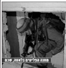
מחנה הפליטים באלטה, שכם

נקודה נוספת למחשבה. כל העת מנסים גורמים מסויימים לערער את כדאיות התגובה הצבאית, כשהם מציינים כדבר ודאי שבפעולה צבאית שוב ייפגעו חיילינו (ח"ו), ובמילא אין כדאי לחשוב בכיוון כזה וכו'. והנה מתברר, כי המציאות למרבית הפלא היא בדיוק הפוכה.