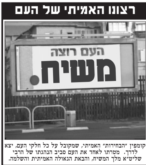
קומפין "הבחירות" האמיתי, שמקובל על כל חלקי העם, יצא לדרך. משרתו לאחד את העם סביב הנהגתו של הרבי שליט"א מלך המשיח, והבאת הגאולה האמיתית והשלמה.

כעת גם שכלו המגושם של הקצין הגוי הבין, אין זו מקריות. הוא פנה