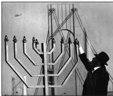
מול גשר ברוקלין

באחד מלילי חנוכה הדליק את ה"שמש" של המנורה הגדולה ריטשרד ("דיק") געפהארט, מנהיג הדמוקרטים בקונגרס האמריקאי בווינגטון.