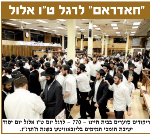
"חאדראם" לרגל ט"ו אלול ריקודים סוערים בבית חיינו - 770 - לרגל יום ט"ו אלול יום יסוד ישיבת תומכי תמימים בליובאוויטש בשנת ה'תרנ"ז.

אלא שלמילוי משימה זו, נדרשה נשמה גבוהה עוד יותר. הייתה זו נשמת אדמו"ר הזקן, רבי שניאור זלמן, בעל התניא והשולחן ערוך מייסד חסידות חב"ד, אשר כעדות מורו ורבו המגיד ממעזריטש, כפי שנמסרה ע"י הבעש"ט, הייתה זו "נשמה חדשה"! מפנימיות עתיק (בחינות נעלות ביותר באלוקות), שלמעלה מכל סדר ההשתלשלות. נשמה מסוג הנשמות שיתגלו לעתיד לבוא בעולם התחיה. רק נשמה כזו ביכולתה להוריד ולהמשיך את עומק תורת החסידות לנשמות הנמוכות של "עקבתא דמשיחא" ולהחיות בחיות חדשה בעבודת ה'.