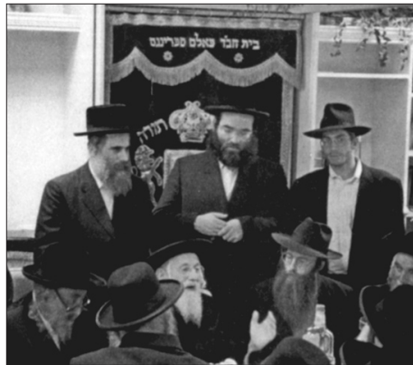
האדמו"ר מבאבוב זצ"ל מתוועד בבית חב"ד