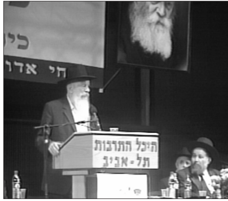
הרב שמואל חפר

הרב זלמן נוטיק משפיע בישיבת "תורת אמת" בירושלים, מספר על "שבע מצוות בני נח" ועד היכן מגיעה ההשפעה עליהם. אדיר זיק מערוץ 7, מספר כי בכינוסים של חב"ד הוא תמיד מרגיש ב"בית". את האישיות התורנית אותה הוא רואה כבעלת סמכות בכל נושא שלימות הארץ, זהו רב ב.י. עוברים להקרנת וידאו יחודי, על הרבי שליט"א מלך המשיח.