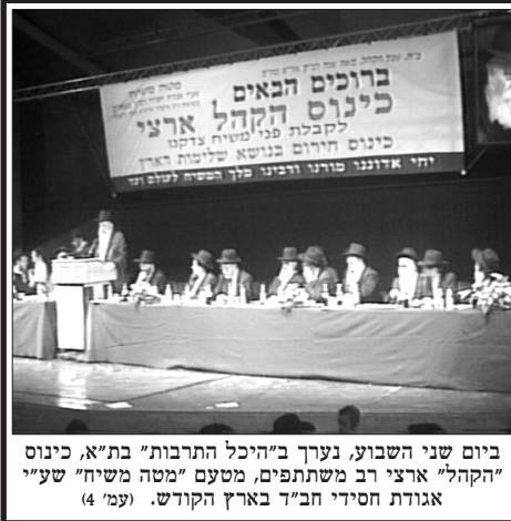
ביום שני השבוע, נערך ב"היכל התרבות" בת"א, כינוס "הקהל" ארצי רב משתתפים, מטעם "מטה משיח" שע"י אגודת חסידי חב"ד בארץ הקודש. (עמ' 4)