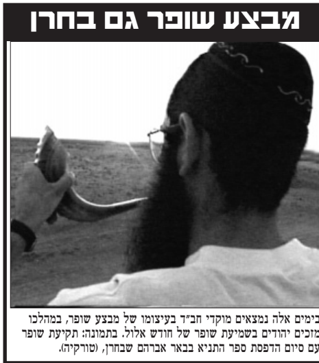
בימים אלה נמצאים מוקדי חב"ד בעיצומו של מבצע שופר, במהלכו מזכים יהודים בשמיעת שופר של חודש אלול. בתמונה: תקיעת שופר עם סיום הדפסת ספר התנייא בבאר אברהם שבחרן, (טורקיה).

כיצד, זה שגילוי אלוקותו ית', התגלות המלך הקדוש בחודש אלול, אינה דורשת את ההכנות המרובות כמו אלה הנדרשות לקראת כל חג ומועד?