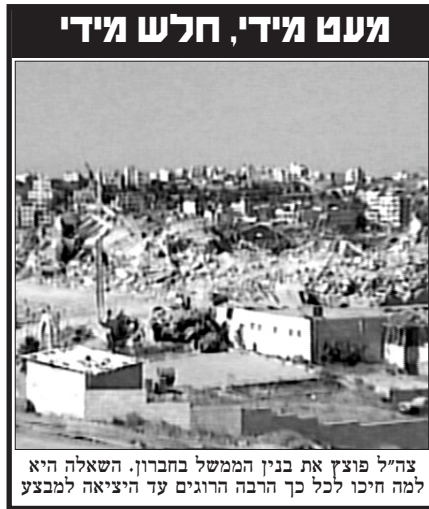
צה"ל פוצץ את בנין הממשל בחברון. השאלה היא למה חיכו לכל כך הרבה הרגים עד היציאה למבצע