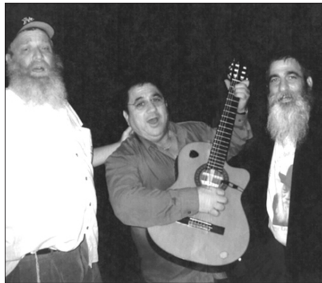
הזמר אהרון (אונרי) בן סימון

ז' באדר (יום הולדתו של משה רבנו) ותוכנה, ימי הפורים הקרבים, וסיפור חז"ל על מרדכי היהודי שכינס כ"ב אלף תינוקות של בית רבן ללמד תורה - עד שקראו פה אחד: "בין בחיים בין במוות - עמך אנו - ועלינו לדעת שחובה על כל אחד ואחד, בכל מצב בו הוא נמצא להתעסק בענייני חינוך, וכך נוכל להיות בטוחים שהדור הצעיר יהיה נאמן לה' ולתורתו. לסיום מברך הרבי שליט"א מלך המשיח, בהצלחה בעבודתכם ובעיקר להרבות מספר בני ובנות ישראל המושפעים על ידכם - ויהי רצון שיתקיימו בכל מידותיו הטובות של הקב"ה בריבוי". ואכן תוצאות הברכה נראו בשטח, ב"ה.