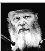
(פרישת האיזנו תשמ"ט)