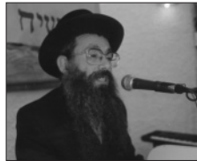
הרב ישעיהו הרצל