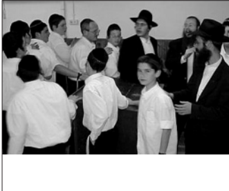
רוקדים גם למחרת הנס

הוצאתי את הטלפון הסלולרי שלי, כשעל הצג הפוע מספרו של הרב וולפא מקרית גת, שהיה האחרון שהתקשר אלי.