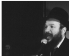
הרב יוסף הכט