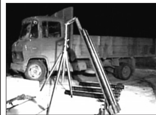
משאית הטיילים שנתפסה בדרכה משכם לג'נין

עד כאן סיפור גניבת המיכשור הרפואי, המהווה נזק בפני עצמו. אלא שכעת אני שואל את עצמנו: אם משאיות גדולות מלאות בציוד גנוב במשקל של טונות, מצליחים לחלוף על פני מחסומים ונקודות ביקורת של צה"ל, משטרת ישראל ומשמר הגבול ללא כל בעיה, וכל ה"סגרים" וה"כתרים" אינם מתכוונים אפילו למונע את העברת הציוד הגנוב - להזכירכם, מדובר בסדרים גדול המועברים במשאיות - מתחת אפס של כוחות הבטחון, אז מה הבעיה לפלסטינים להעביר מתחת אפס של כוחות הבטחון, משאיות של טיילים ונשק ושאר אמל"ח.