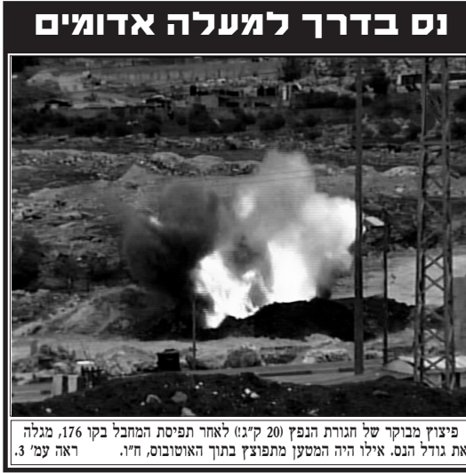
פיצוץ מבוקר של חגורת הנפץ 200 ק"ג לאחר תפיסת המחבל בקו 176, מגלה את גודל הנס. אילו היה המסען מתפוצץ בתוך האוטובוס, ח"ו. ראה עמ' 3.

הצורך מעזה, שעד לפני מספר שנים היה מוקצה מחמת מיאוס אצל מנהיגי העולם החופשי וגם בקרב מדינות ערב, זוכה להכרה בינלאומית ושועי עולם משחרים לפתחו.