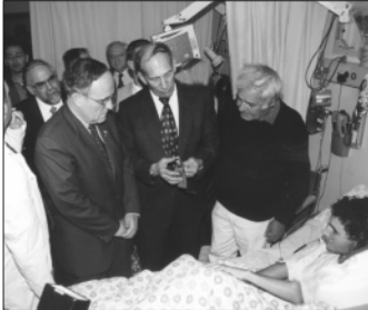
מר ג'ולאני רה"ע ניו יורק לשעבר, מתבונן בארנק ובמטבע המחורר, שבידי רה"ע ירושלים, מר אהוד אולמרט.

קרוב לחצות, נשמע פיצוץ עז שהחריד את כל מרכז ירושלים. תוך דקות החלו כוחות הצלה להזרים את הפצועים לבתי הרפואה השונים ברחבי העיר.