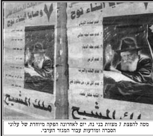
מסה להפצת 7 מצוות בני נח, יום לאחרונה הפקה מיוחדת של עלוני הסברה ומודעות עבור המגזר הערבי.

בשיחתו הידועה מכ"ח ניסן ה'תשנ"א, מדבר הרבי שליט"א מלך המשיח אודות העקשנות הנדרשת: מכל אחד מאתנו: ויהי רצון שסוף-כל-סוף ימצאו עשרה מישראל ש"יתעקשו" שהם מוכרחים לפעול אצל הקב"ה. ובודאי יפעלו אצל הקב"ה - כמו שכתוב "כי עם קשה עורף הוא (למעלותא, ולכן) וסלחת לעווננו ולחטאתנו ונחלתנו" - להביא את הגאולה האמיתית והשלימה תיכף ומיד ממש.