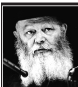
(פרשת וישב תשמ"ח)