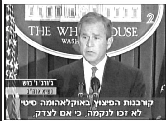
ג'ורג' בוש נשיא ארה"ב, בנאומו: הוצאתו להרוג של המפגע באוקלהומה, אינה נקמה אלא עשיית צדק! מתי ילמדו זאת אצלנו?

הרי כשהם היו אתנו כאן, לפני יציאתם לשליחות הם היו כשרים? מה הפחיד אותם כל כך? איך זה קורה שאדם מחליף את דעותיו וערכיו בתוך מספר ימים?