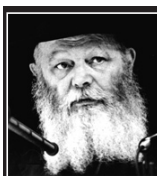
(י' שבט ה'תשנ"ב)

בנוסף ללימוד היומי בחת"ת (חומש, תהילים, תנאים) ישנה סגולה בהחזקת ספרים קדושים אלו בכל מקום ואף ברכב