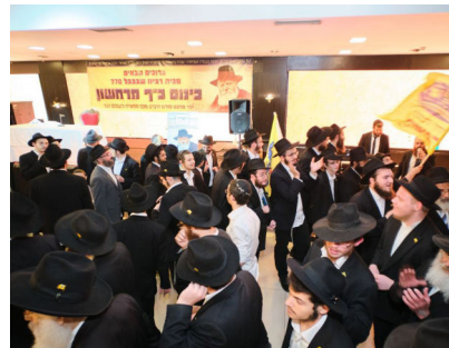
ברוכים הבאים מ-770 מאות השתתפו בשבוע שעבר, בכינוס לקבלת פני השבים מחודש תשרי ב-770

לוח השנה היהודי מורכב מחגים ותאריכים בעלי משמעות. אלא, שבניגוד לתפיסה הרווחת כאילו ימים אלו מציינים אירועים שאירעו בעבר ותו לא, הרי שתורת החסידות מלמדת שבכל תאריך שבו ישנה התעוררות מחדש של אותן פעולות ומעשים שהתחוללו באותו זמן.