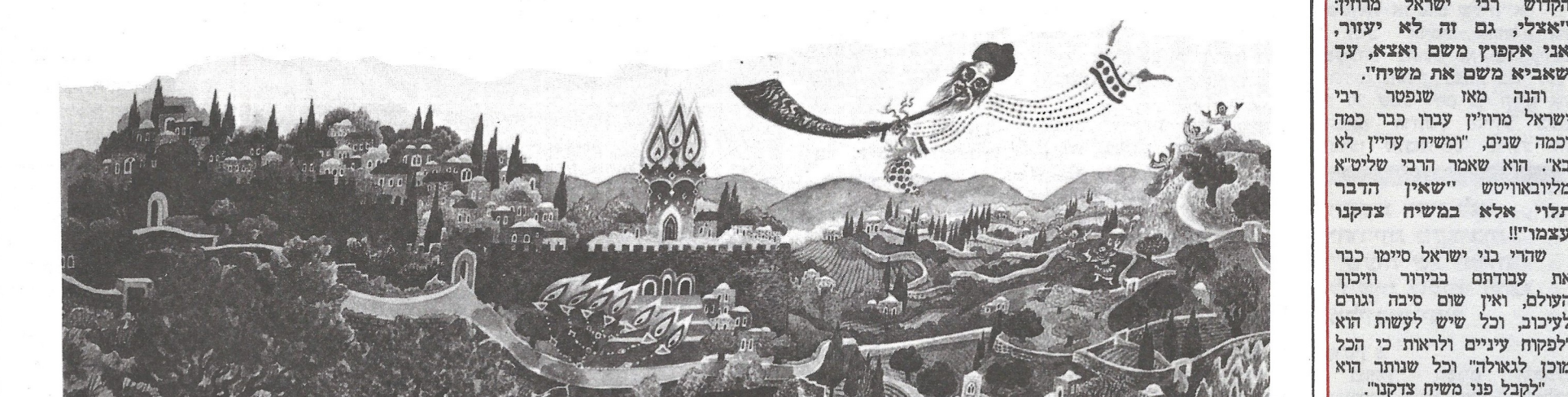
"ענווים, הגיע זמן גאולתכם!" פרי מכחולו של הצייר דוד נחשון. המשך בעמ' הבא

לראות כיצד התקיימו הדברים, שדווקא ישראל הם שיאמרו עפ"י המדרש "להיכן נבוא ונלך?". "להיכן נבוא ונלך?". ביטוי קצת מוזר לכל הדעות, אבל כשנזכרים ביוכח שהתעורר, האם לרדת למקלט או להשאר בחדר האטום. זה כבר מזכיר קצת את דברי המדרש להיכן נבוא ונלך?!