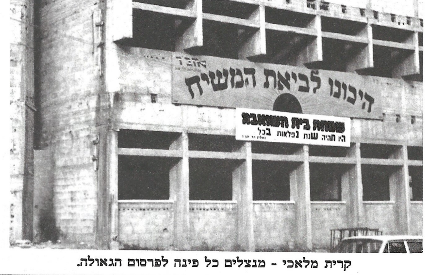
קרית מלאכי - מנצלים כל פינה לפרסום הגאולה.