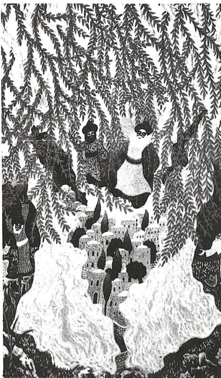
ציור של הצייר ברוך נחשון

ביאת המשיח הינה יסוד עיקרי באמונתנו * כוונת הבורא בבריאה - ביאת המשיח * לעתיד, הקב"ה יתגלה לעם ישראל ולעולם כולו כבמתן תורה ועוד יותר מזה