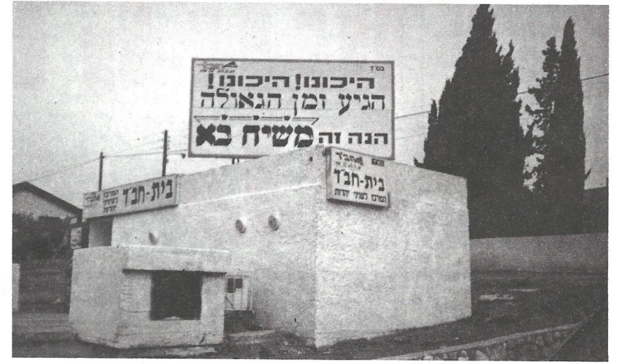
שלט על ההכנה לגאולה - באשקלון.