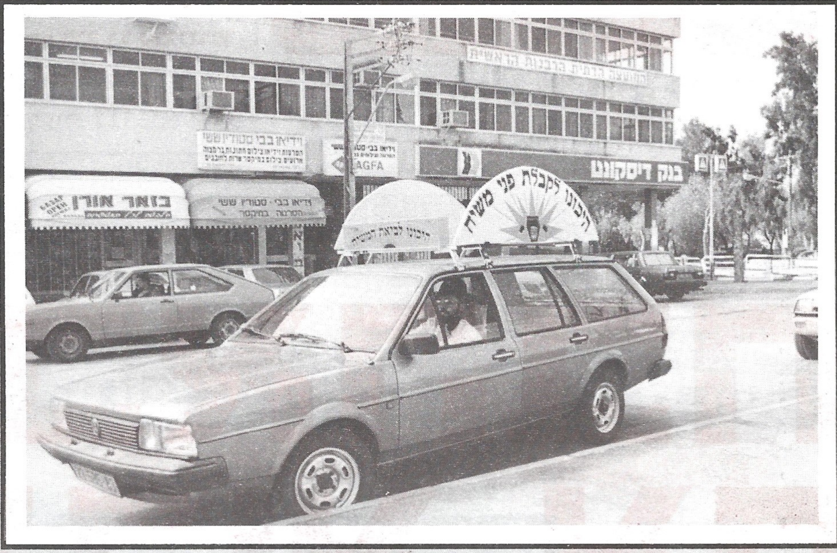
ר' משה ברדוגו שלקה על עצמו את הכנת העיר מגדל-העמק, באמצעות שילוט, לקבלת פני משיח צדקנו (ראה עמ' 8).