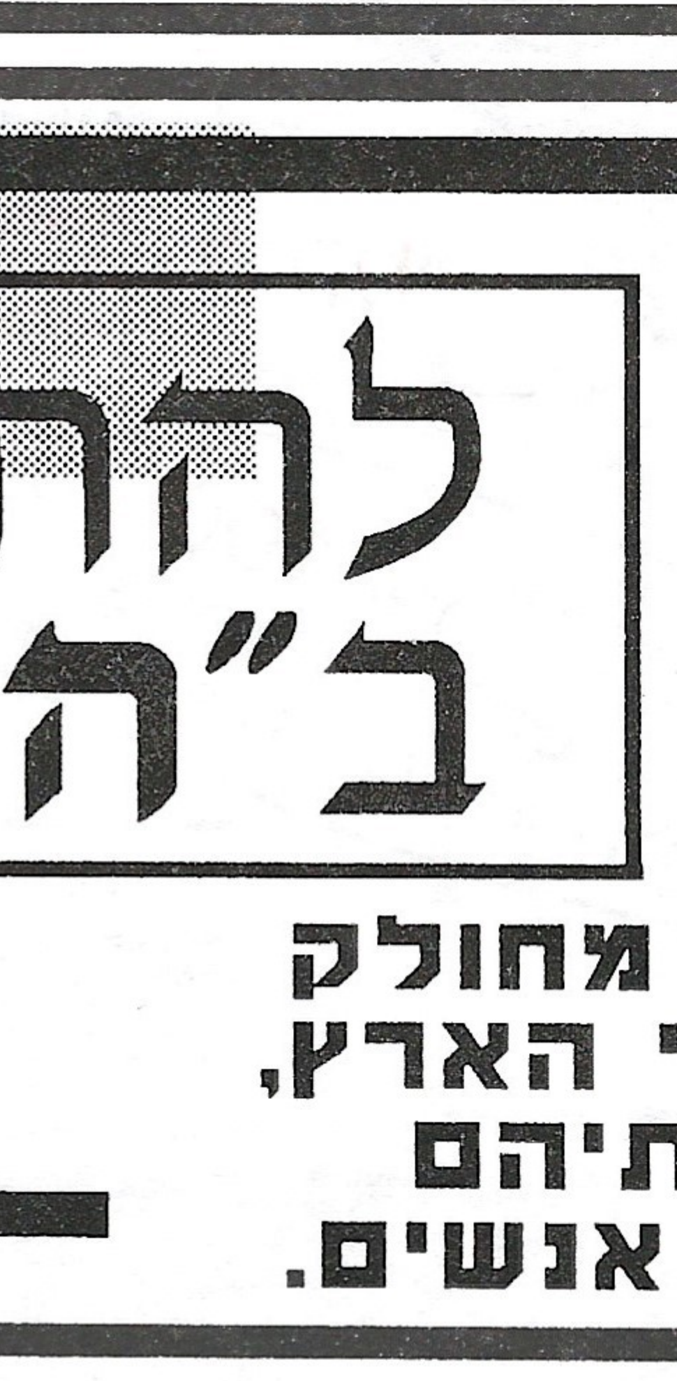
הרב עובדיה יוסף שליט"א: "הרבי מליובאוויטש שליט"א מפיץ אמונה צרופה בעם ישראל, תורה ואמונה במסירות נפש".

אך יש בני אדם שפוסלים את הערב הזה רק בגלל ששם חב"ד נקרא עליו. הרי כבר דוד המלך העיר: "חבר אני לכל אשר יראוך". ואני מוסיף ואומר, אל תקרי חבר אלא חב"ד. כי ה"ריש" ו"דלית" מתחלפים. אנחנו רואים בתורה שפעם נאמר "אליסף בן דעואל" ופעם נאמר "אליסף בן רעואל", "דלית" ו"ריש" מתחלפים. או "חבר אני", אמרו - חב"ד אני! "חב"ד אני לכל אשר יראוך". אתה רואה אנשים שמזכים את הרבים, שמזכים גם כאלה שמעולם לא הניחו תפילין, שלא השאירו פינה בעולם שלא הלכו אליה וזיכו אותה.