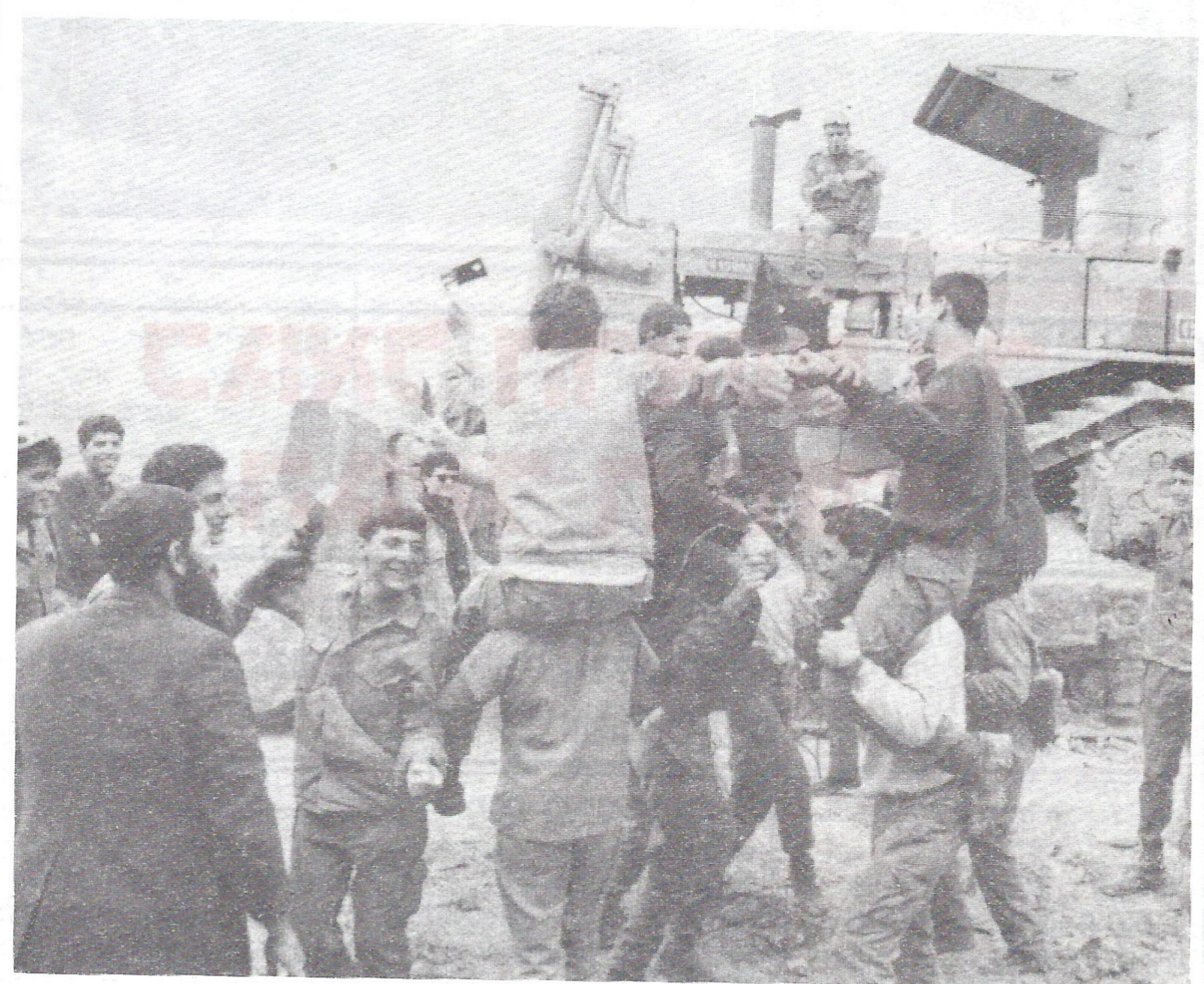
חיילים וחב"דיניקים בשמחת פורים