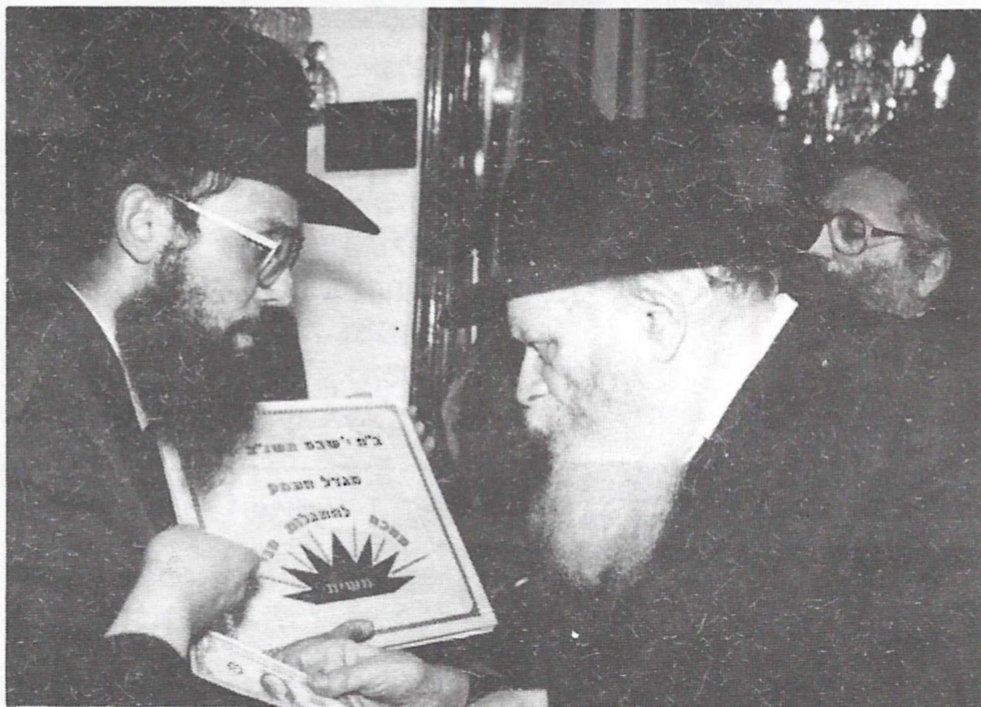
ר' משה ברדוגו מגיש את האלבוים לרבי שליט"א

והנה לפתע הגיע הרבי שליט"א ונכנס אל מקומו המיוחד כשבידו היה האלבוים של מגדל העמק. הוא החזיק את האלבוים והתבונן בו באריכות. במיוחד התעכב מבטו ברך הפתיחה, בו כתוב באותיות מזהבות "מגדל העמק תובעת בכ"ח שלמים את הגאולה". לאחר מכן הרבי התבונן בכל דף של האלבוים, תוך שימת לב לכל תמונה המופיעה בו. אין ספק כי התייחסות מיוחדת ויוצאת דופן זו של הרבי מצביעה על החשיבות הגדולה שהוא מייחס לעניין זה של הכנת העיר באמצעות השילוט. ועכשיו הכדור בידינו.