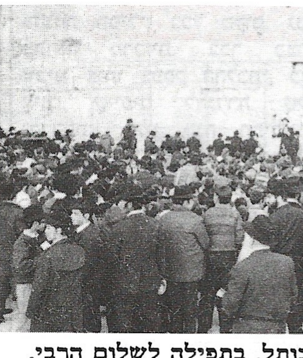
רבבות הילדים שהתאספו בכותל, בתפילה לשלום הרבי.

הידיעה גרמה לתחושה עזה של כאב: "דווקא עכשיו? כאשר רואים תזוזה כה חיובית בנושא הגאולה ומשיח! ניתן היה לחוש בכאב ובתדהמה שבקולו של כל מי שהגייב על השמועה. אך משעברו כמה שעות, החלה להתגבש התגובה. תגובה שביסודה הייתה ההנחה שהוסכמה על הכל, כי האירוע בא לעורר ולחזק עוד יותר, את