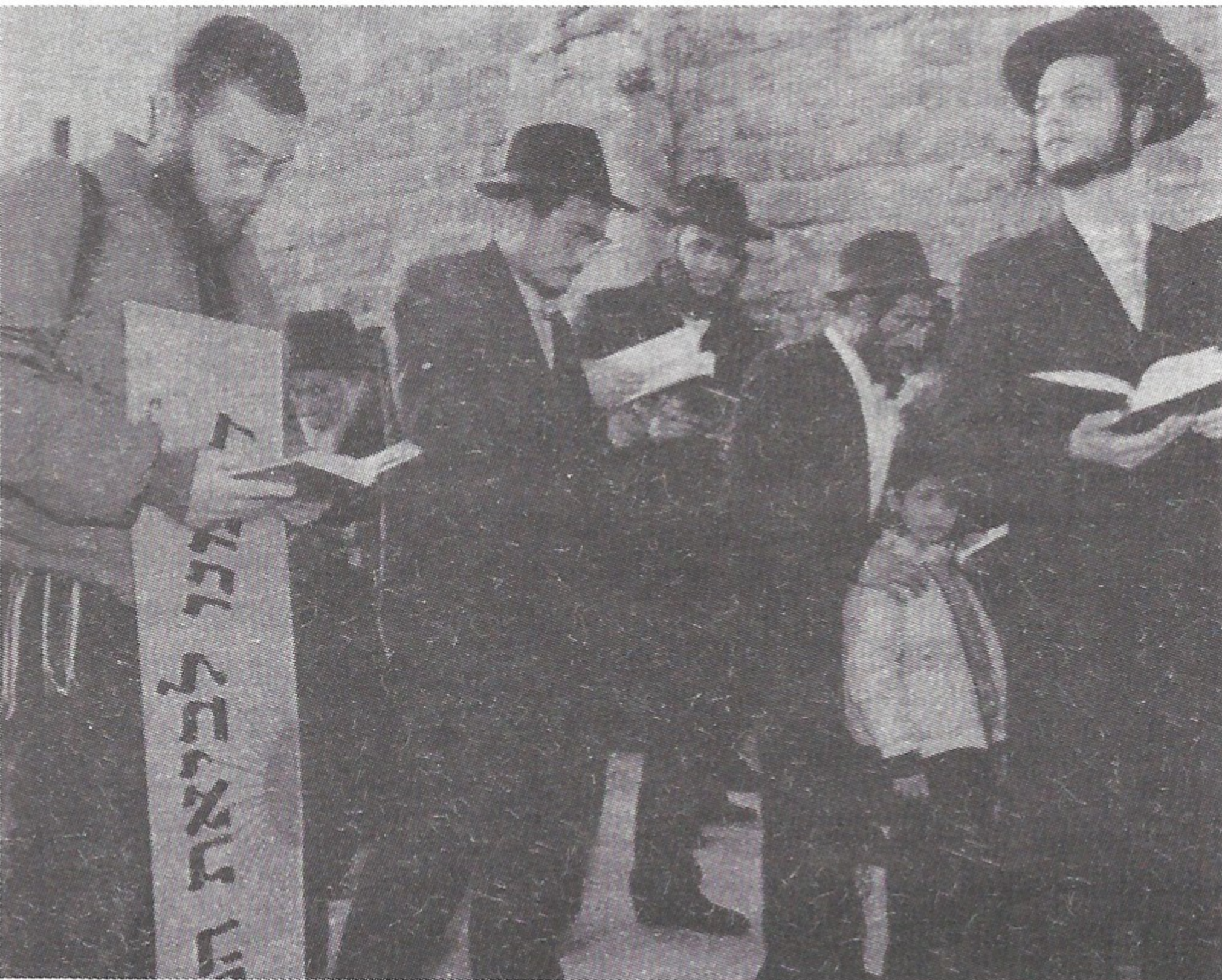
יומיים לאחר כנס הילדים. אלפי יהודים השתתפו בתפילה מיוחדת, ברחבת הכותל, להחלמתו של הרבי מליובאוויטש.

בהחלט התקיים ביום שלישי ה' אדר ב', בכותל המערבי, כינוס זה נקבע ע"י הרבנים, חברי הבית דין צדק של אגודת ישראל. כמו"כ נקרא הציבור להשתתף בכינוס זה ע"י גדולי הרבנים הספרדיים, הראשון הרב מרדכי אליהו, הרב מאיר מזוז, הרב בן שמעון ועוד.