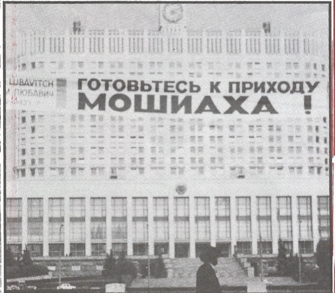
שלט משיח בחזית "הבית הלבן"

הראשונות למשבר קשה היה לצפות את התפתחות העניינים. אכן, לאחר יומיים התממשה הבטחתו לעיני כל. סיום ה'פרשה' הוכיח, שוב צדק הרבי משיח צדקנו בהוראתו - אין צורך לעזוב את מוסקבה ולא