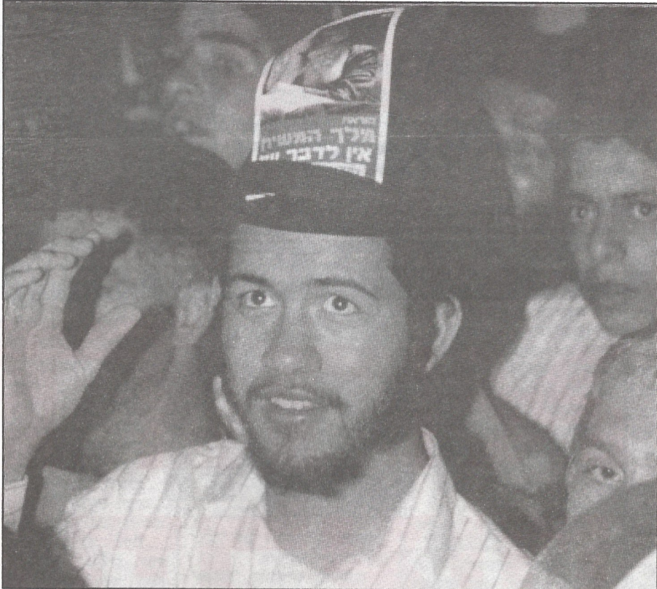
דרך מקורית להפיץ את דבר הרבי מלך המשיח על האיסור שבמסירת שטחים