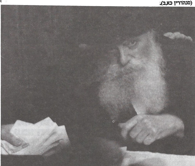
קבלת 'פדיוני נפש' ערב ראש השנה תשנ"ד

תופעה על-טבעית זו לא היתה נחלת דוד המלך בלבד אלא של כל מלכי בית דוד. גם שנים רבות לאחר מכן, בעת הכתרתו של יואש בן אחזיה למלך, מתגלית תופעה זו. יואש, שהיה אז ילד בן שבע!!! הוצא ע"י יהודע הכהן ממקום מחבוא בבית המקדש, והוכתר למלך. והנה בעת ההכתרה כאשר שמו את אותו הכתר המיוחד על ראשו של הילד, כמו שנאמר: 'יוצאיו את בן המלך ויתנו עליו את הנזר ואת העדות' (דברי הימים ב כג,א), ותאם לחלוטין אותו כתר גדול את מידת ראשו של יואש בן ה- 7. כשהדבר משמש כהוכחה