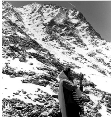
הנחת תפילין, בפיסגת טירפנג'ד שבהימלאיה.

אך ללא ספק גולת הכותרת היה "מסע הגאולה" מסע בן שלוש ימים בהרי ההימלאיה בו השתתפו כעשרים ישראלים. במשך המסלול שכלל חציית קרחונים והגעה לרכס טירפנג'ד למדנו חסידות והתוודענו לחילופין כל העת. לפסגת הרכס (4,000 מ'), עלה איתי רק ישראלי אחד, שרק שם הסכים להניח תפילין והתעטף בציצית ומתוך התרגשות רבה תקע בשופר (ראה תמונה).