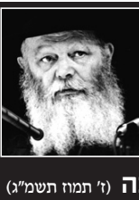
(ד' תמוה תשמ"ג)

"זאכן עושים גם היום" - שכמה וכמה עשרות מישראל מטלטים את עצמם ... מבייתם ומקומם, כדי לשהות במשך מועדי חודש תשרי בד' אמותיו של נשיא דורנו, מעין ודוגמת זכר לענין דעלילה לרגל. (תשרי תשמ"ז)