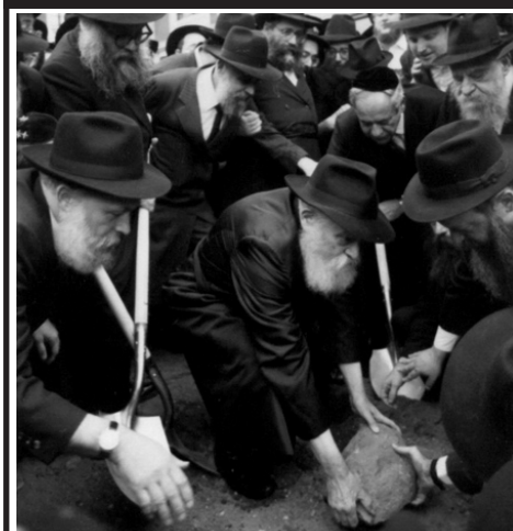
ח"י אלול ה'תש"מ. הרבי שליט"א מלך המשיח מניח אבן פינה להרחבת בית רבינו שבבבל, כהכנה לביהמ"ק השלישי.