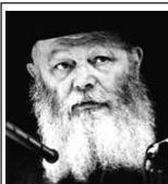
(מדברי הרבי מה"מ שיל"ו למר משה קצב)

יחד עם הלימוד היומי בשיעורי החת"ת (חומש, תהילים, תניא) קיימת סגולה בהחזקת ספרים