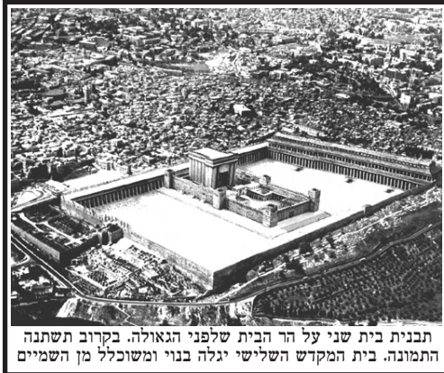
תבנית בית שני על הר הבית שלפני הגאולה. בקרוב תשתנה התמונה. בית המקדש השלישי יגלה בנוי ומשוכלל מן השמיים