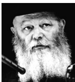
(י' שבט ה'תשנ"ב)

ידוע ומפורסם בתפוצות ישראל מכמה וכמה שנים על דבר המנהג שיבימי בין המצרים