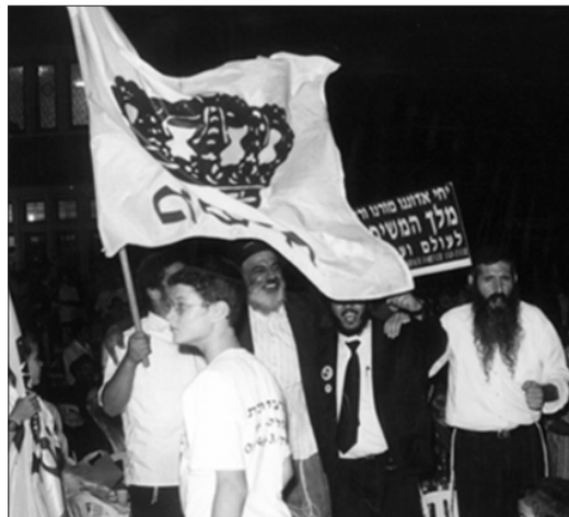
ריקודים מתוך אמונה ובטחון

ג' תמוז, היום בו מתגלית האמונה בעצמותו ית', שהורנו כי עתיד משיחנו להתכסות אך חוזר ונגלה לישראל וגואלם. ביום זה מתאחדים השמחה והבטחון בהתגלותו המלאה והמשולמת של הרבי מלך המשיח שיל"ו תיכף ומיד ממ"ש.