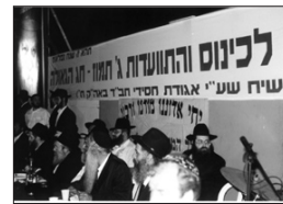
מאז עליית הרבי שליט"א משיח צדקנו לנשיאות לפני - 50 שנה, ראו הכל שלא

שני אירועים אלה, שארעו בג' תמוז באו להכין אותנו לקראת הפעם השלישית בו נפגש עם ישראל והעולם כולו בתאריך זה.