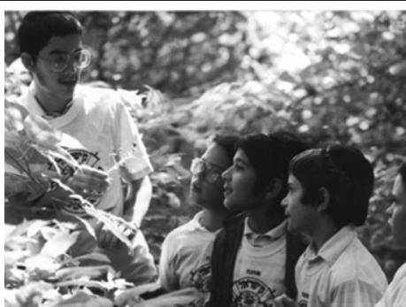
החל הרישום לקייטנות הגאולה של חב"ד, שיעמדו השנה בסימן קבלת פני משיח צדקנו ובניין בית המקדש השלישי