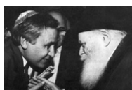
(י' שבט ה'תשנ"ב)

תניא - שיעור בתניא, כפי שנחלק לימות השנה