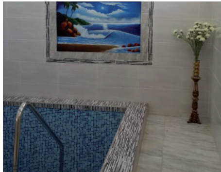
המקווה המהודר בניקרגואה

כמו כן הגיע במיוחד להתחלה לפני 5 חודשים... מנהל "קרן מקוואות", העוזרת ותומכת בבניית מקוואות ברחבי העולם, באמצעות הרב רייטפורט וקרן "מרומים". "יהי רצון", אומרים זוג השליחים, שתהא זו הפעולה האחרונה להבאת התגלות הרבי שליט"א מלך המשיח, תיכף ומיד ממש".