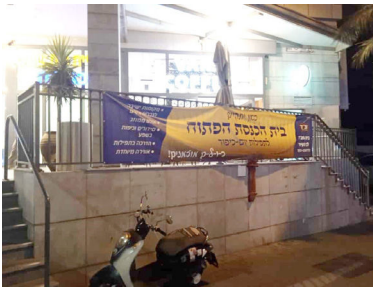
השלט על התפילות בכניסה לבניין העירייה

רק הביטוח על הציוד עולה 150,000 ש"ח בשנה לא יעזור לי גם שתיתן צ'ק פיקדון, כי אם יקרה נזק בבניין הצ'ק שלך לא יתחיל לגרד... לכן אינני מעיז לאשר תפילות בלובי