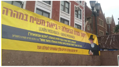
שלט בכניסה ל-770, ביוזמת המטה