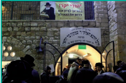
לרגל יום ז' באדר הילולת משה רבינו, התקיימה בציון רשב"י במירון, פעילות עניפה להתקשרות אל הרבי שליט"א מה"מ, ודרשה לזיווג הגאולה.