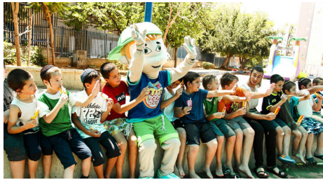
בובת אודי עם ילדי אחד הסניפים

ברשת יהודוס יודעים להצביע על צמיחה משמעותית שנראתה השנה בכמות הסניפים ובמספר הנרשמים, בזכות ברכות והדרכות שקיבלו מהרבי שליט"א מלך המשיח באמצעות האגרות קודש. כמו כן מציינים בסיפוק את התכנית האכותית והמושקעת. בזכות פעילות יהודוס קיבלו אלפי ילדים חינוך יהודי למסורת וערכים באמצעות פעילות מאתגרת ומהנה, בשילוב יצירות מושקעות שהקנו להם ידע עשיר ומרתק. לאחר שבועיים של פעילות, אלפי החניכים בוודאי מוכנים יותר לקבל את פניו של הרבי שליט"א מלך המשיח בנאולה האמיתית והשלמה. ■