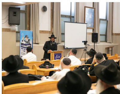
מאות ביום לימוד גאולה ומשיח בשבוע שעבר התקיים יום העיון 'שיבה ליום אחד' ללימוד עניני גאולה ומשיח

הפטרות השבת 'עניה סוערה', מביאה עוד חלק בסדרת שבע הפטרות הנחמה הנקראות בין תשעה באב לראש השנה. שבע שבתות בהן עם ישראל קורא מידי שבת מתוך דברי הנביאים שהתנבאו על העתיד לבוא, תיכף ומיד ממש, בגאולה האמיתית והשלימה.