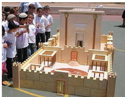
גם ילדים בונים במסגרת לימודי בית המקדש בימים אלו, משתתפים גם הילדים בשיעורים מותאמים

לא פעם, כאשר עולה הצורך בלימוד עניני גאולה ומשיח בתורה והשתתפות בשיעורים העוסקים בנושאים אלו, נתפס הדבר רק כמין "סגולה" כדי למהר את התגלותו של הרבי שליט"א מלך המשיח. לא רק, הצורך בלימוד ענינים אלו באופן קבוע, הוא כדי להרגיל את עצמנו לחיות במצב של גאולה ולהסתכל נכון סביבנו.