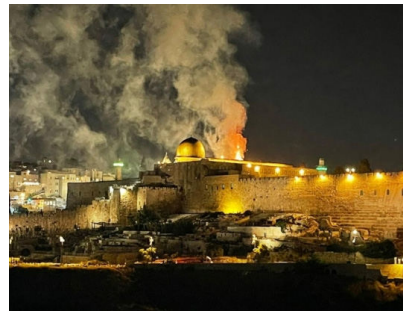
"ובאש אתה עתיד לבנותה" זממראות השבוע בירושלים. תזכורת לבית המקדש שירד משמים עם חומות אש סביב

התפרצות סבב האלימות החמור שראינו השבוע מצד התושבים הערבים ברחבי ישראל ועמידתם לצד חבריהם המחבלים מעזה וירושלים, הפתיעה רבים. אך כרגיל, הכתובת הייתה על הקיר. במשך שנים ארוכות מזהיר הרבי שליט"א מלך המשיח, כי הכניעה לטרור הערבי, לא תגרום דעיכה במעשים, אלא אדרבה התגברות והתעצמות תוך שחוצפתם תגבר, והנה השבוע שוב קיבלנו תזכורת כואבת להתממשות דברי אזהרתו.