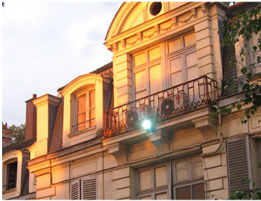
חזית ישיבת חב"ד בברינואה, צרפת